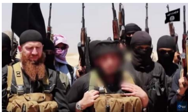
עמר הצ'צ'ני (משמאל), בסרטון שפרסם דאעש, בעת שהכריז על הקמת הח'ליפות (יוטיוב, 29 ביוני 2014)

המאמר הראשי באלנבא', שבועון דאעש, הוקדש השבוע לקריאת דאעש ללוחמים זרים ("המהגרים") השוהים בסוריה להצטרף לשורות הארגון. במאמר, שהתפרסם תחת הכותרת "האין ביניכם עמר חדש?!" 3 מציין כותב המאמר, שאלה מבין הלוחמים הזרים שלא הצטרפו לשורות דאעש מוצאים עצמם אסירים של המטה לשחרור אלשאם, המזוהה עם ארגון אלקאעדה, במובלעת המורדים באדלב, או שהם מוצאים להורג ברחובות אדלב או הופכים ליעד להתקפות כלי טייס של גורמים שונים. הוא מדגיש, כי פעילותם כ"עצמאיים" רק מחלישה אותם, וקורא להם להצטרף לשורות דאעש (שבועון אלנבא', טלגרם, 28 באוקטובר 2021). נראה כי דאעש שואף לנצל את המתיחות בין ארגוני הג'האד באזור מובלעת המורדים באדלב שבסוריה, שרבים מקרבם הם מהגרים ממזרח אירופה לבין המטה לשחרור אלשאם. כמו כן חושף המאמר את חולשת הארגון והצורך שלו לגייס בדחיפות לוחמים, כולל זרים.