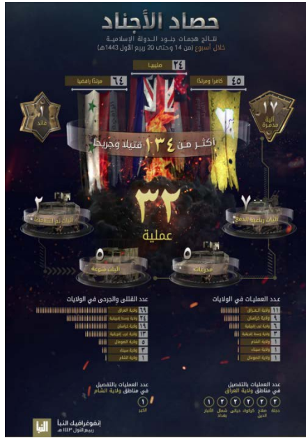
אינפוגרף המפרט את הפיגועים במחוזות השונים (שבועון אלנבא, טלגרם, 28 באוקטובר 2021)