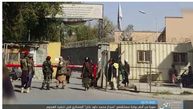
שער בית-החולים לפני הפיגוע, כפי שפורסם על-ידי סוכנות אעמאק של דאעש (טלגרם, 2 בנובמבר 2021).

◀ השבוע נמשכה פעילות דאעש נגד כוחות הטאלבאן. האירוע הבולט השבוע היה פיגוע משולב נגד בית החולים הצבאי סרדאר מחמד דאוד ח'אן, המופעל על ידי טאלבאן, בבירה קאבול . על פי דיווחים עיתונאיים את הפיגוע ביצעו מספר מחבלים, ביניהם לפחות מחבל מתאבד אחד. זביהוללה מג'אהד (Zabihullah Mujahid), דובר טאלבאן , ציין כי הפיגוע בוצע על-ידי מספר פעילי דאעש, שאחד מהם פוצץ חגורת נפץ שלבש בשער בית החולים. כמו כן התפוצצה מכונית תופת שעמדה מחוץ לבית החולים שגרמה לעשרות נפגעים, ביניהם גם אנשי טאלבאן (רויטרס, 2 בנובמבר 2021; ניו יורק טיימס, 2 בנובמבר 2021).