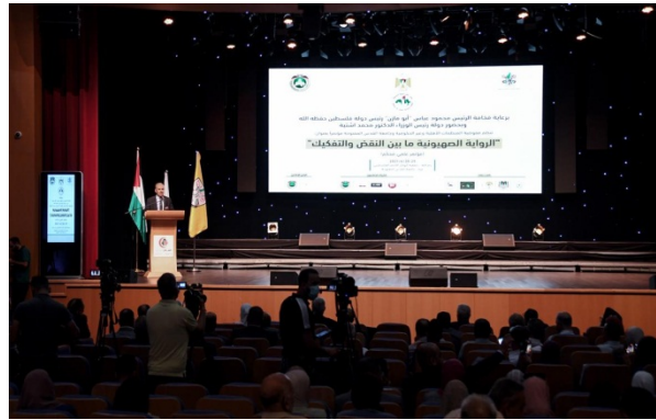
הכנס בראמאללה. מימין: שלט על הבמה בו מודגש כי הכנס מתקיים בחסות אבו מאזן (ופא, 29 ביוני 2021)

◀ את הכנס פתח אבו מאזן בנאום מוקלט בו ציין שדעת הקהל הבינלאומית עוברת לאחרונה שינוי הדרגתי לכיוון קבלת הנרטיב הפלסטיני. הוא הוסיף, כי שינוי זה מתרחש במיוחד בארה"ב ובאירופה. לדבריו, רוב המדינות הללו עדות לפעילויות בנושא שמקיימת הקהילה הפלסטינית בפזורה. אבו מאזן ציין, שיש להתגייס ולהמשיך לפעול בכיוון כדי להגיע למקבלי החלטות בכל המדינות בהן מתרחשים השינויים הללו. זאת, לדבריו, כדי להדגיש את חוזקו של העם הפלסטיני, את זכותו לשהות באדמות שלו ואת השגת העצמאות הפלסטינית במדינה שבירתה תהיה מזרח