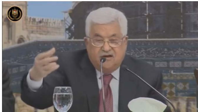
אבו מאזן נושא נאום בפתיחת כינוס המועצה הלאומית הפלסטינית בראמאללה (ופא ביוטיוב, 30 באפריל 2018)

◀ אבו מאזן ציין, כי העלה את הסקירה ההיסטורית בתגובה "לסיפור השגוי שישראל מנסה לשווק" . כדי לתת תוקף לדבריו הוא אף טען, כי כל הדברים שאמר מסתמכים על ספרים שנכתבו על ידי יהודים. את "שיעור ההיסטוריה" שלו, מסיים אבו מאזן בקריאה לפתרון שתי מדינות: "אנו לא אומרים, הבה ונעקור אותם. [אנו אומרים:] נחיה עמם על יסוד שתי המדינות" (ופא, 30 באפריל 2021).