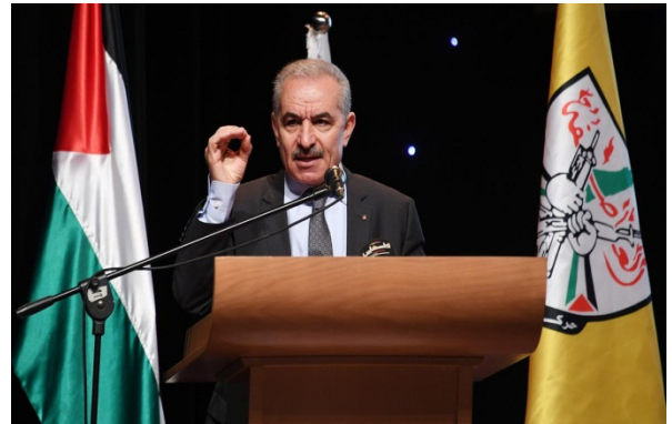
ראש הממשלה הפלסטיני מחמד אשתיה נושא נאום בכינוס בראמאללה (ופא, 29 ביוני 2021)

◀ דוברים נוספים בכנס חיזקו את דבריו. כך למשל, ד"ר יונס עמרו, נשיא אוניברסיטת אלקדס הפתוחה, ציין, כי אין קשר בין היהודים לירושלים. הקשר שלהם הוא קשר של מלחמה, כפי שמוזכר בסיפור המקראי לפיו דוד המלך רכש אדמות בירושלים מארוונה היבוסי [דמות מקראית המוזכרת בספר שמואל] כדי לבנות מקדש לעבוד את בוראו. לפיכך, טוען ד"ר עמרו, אין ליהודים כל קשר דתי לירושלים. הקשר הדתי היחיד לירושלים הוא של הנוצרים והמוסלמים. ירושלים היא אדמת השלום ממנה עלו השמימה ישו ומחמד. ירושלים היא מקום עלייתם לרגל של הנוצרים ובדת האסלאם היא המקום השלישי בקדושתו [אחרי מכה ומדינה] (ופא, 29 ביוני 2021).