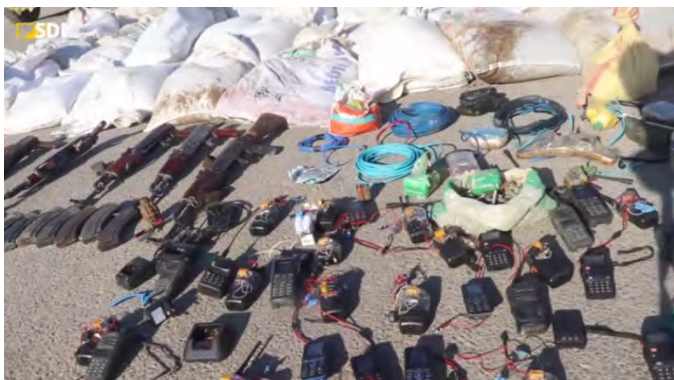
מימין: חלק מאמצעי הלחימה של דאעש שאותרו בעיירה אלבצירה. משמאל: מטעני חבלה שנמצאו