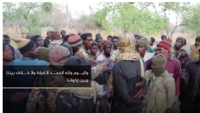
פעילי בוקו חראם נשבעים אמונים למנהיג דאעש (טלגרם, 25 ביוני 2021).