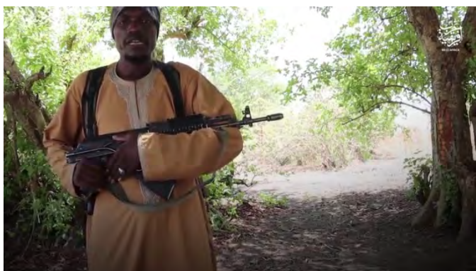
מימין: פעיל דאעש דובר ערבית שתועד בסרטון. משמאל: פעילי בוקו חראם ביער סמביסה (טלגרם, 25 ביוני 2021).