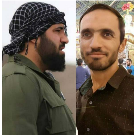
שני לוחמי משמרות המהפכה שנהרגו בסוריה (מהר, 3 ביוני 2021).