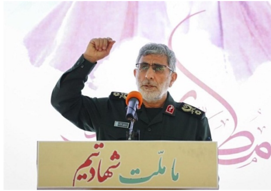
מפקד כוח קדס של משמרות המהפכה (תסנים, 29 במאי 2021).

◀ חסין-אמיר עבדאללהיאן (Hossein Amir Abdollahian), יועצו לעניינים בינלאומיים של יו"ר המג'לס האיראני, אמר בריאיון לערוץ אלמסירה התימני (28 במאי 2021), כי מבצע "שומר החומות" חשף את שברירות "הישות הציונית" ואת כישלון מערכת "כיפת ברזל" על אף התמיכה האמריקאית והמערבית בישראל. הוא ציין, כי חלומם של הציונים להקים מדינה יהודית "מהנילוס ועד הפרת" לא יתממש לעולם, והדגיש, כי איראן לא תהסס להיענות לכל דרישותיו של העם הפלסטיני והנהגתו.