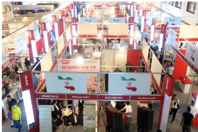
הדוכן האיראני ביריד המסחר הבינלאומי ה-60, שהתקיים בדמשק בספטמבר 2018 (אירן"א, 2 בספטמבר 2018)