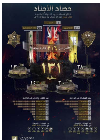
אינפוגרף המסכם את פעילות דאעש

◆ אינפוגרף המסכם את פעילות הארגון בין 6-13 במאי 2021 : בתקופה זו ביצעו פעילי דאעש 131 התקפות במחוזות השונים באסיה ובאפריקה, לעומת 81 התקפות, שביצעו בשבוע שקדם לכך. מספר ההתקפות הגדול ביותר בוצע בעיראק (62). ההתקפות, בשאר המחוזות: סוריה (30); ח'ראסאן, קרי: אפגניסטאן (16); מערב אפריקה (9); סיני (7); מרכז אפריקה (5); פקיסטאן (1); הודו (1) (שבועון אלנבא', טלגרם, 15 במאי 2021). על-פי האינפוגרף, בהתקפות הללו נהרגו ונפצעו לפחות 216 בני אדם, לעומת 168 בני אדם בשבוע שקדם. מספר הנפגעים הגדול ביותר היה במערב אפריקה (69). השאר היו במחוזות עיראק (68); סוריה (34); ח'ראסאן, קרי: אפגניסטאן (23); סיני (9); הודו (6); מרכז אפריקה (5); פקיסטאן (3) (שבועון אלנבא', טלגרם, 15 במאי 2021).