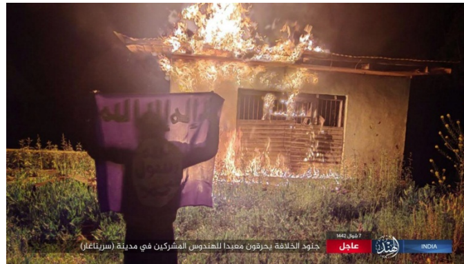
העלאה באש של מקום התפילה ההינדי (טלגרם, 19 במאי 2021).

◀ רימונים הושלכו לעבר מחסום של צבא הודו בסרינגאר (Srinagar) בקשמיר. נגרמו נזקים חומריים. ▶ מחוז הודו של דאעש פרסם תיעוד של העלאה באש של מקום תפילה הינדי בסרינגאר (Srinagar) בקשמיר (טלגרם, 19 במאי 2021). לא צוין מתי התרחש האירוע, אך ככל הנראה מדובר בשבוע האחרון. יש לציין כי דאעש רואה בהינדים כופרים.