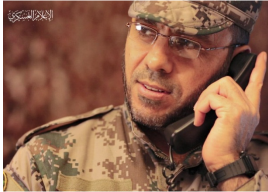
באסם עיסא (אתר גדודי עז אלדין אלקסאם, 12 במאי 2021).

◆ סאמי רצ'ואן, מפקד בזרוע הצבאית של חמאס (אלערבי אלג'דיד, 14 במאי 2021; סמא, 13 במאי