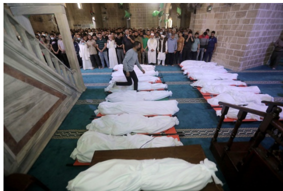
הלוויית הרוגים בתקיפות צה"ל בשכונת רמאל בעזה גופות ההרוגים נעטפו בתכריכים לבנים ולא בדגלי פלסטין או דגל הארגון אליו השתייכו (חשבון הטוויטר של PALINFO, 17 במאי 2021)

◀ כמו במבצעים קודמים והפעם אף יותר, ממעטים גורמים ברצועה (משרד הבריאות וארגוני הטרור) לתת פומבי למותם של פעילי טרור. זאת, למעט פעילים בכירים שעל מותם התפרסמו הודעות רשמיות מטעם הארגונים אליהם השתייכו. ממשל חמאס מנסה ליצור מצג שווא לפיו הרוב מכריע של ההרוגים היו אזרחים בלתי מעורבים. משרד הבריאות ברצועת עזה מדגיש בהודעות שהוא מפרסם את מספר הנשים, הילדים והקשישים שנהרגו ובניגוד לעבר הוא אינו מפרסם רשימות מפורטת הכוללות את שמות ההרוגים. גם ברשתות החברתיות ובערוצי התקשורת הערביים מוצגים חלק גדול מפעילי הטרור ההרוגים כ"אזרחים", מאותה סיבה.