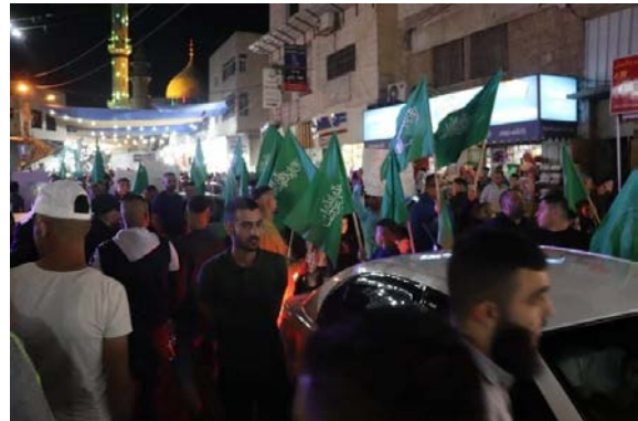
חמאס מקיימת בדורא הפגנת תמיכה והזדהות עם עזה (חשבון הטוויטר של PALINFO, 12 במאי 2021)