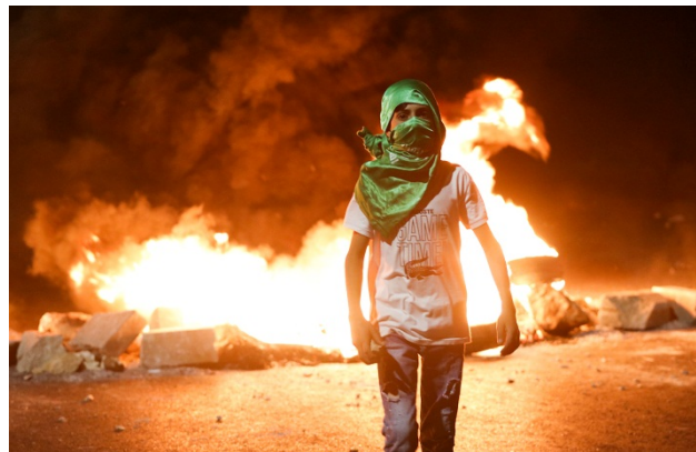
עימותים אלימים (ב-12 במאי 2021) בצומת איו"ש, הכניסה הצפונית לראמאללה, בין מפגינים לכוחות ביטחון ישראליים (ופא, 13 במאי 2021)