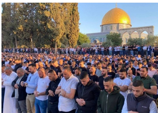
תפילת עיד אלפטר בהר הבית (אתר QUDSN, 13 במאי 2021)

◀ הבוקר (13 במאי 2021) נערכה תפילת עיד אלפטר המונית בהר הבית בה השתתפו כמאה אלף מתפללים. דווח, כי התפילה הוקדשה בין היתר לזכרם של ההרוגים ברצועה. לאחר התפילה קראו מתפללים קריאות עידוד לגדודי עז אלדין אלקסאם, הזרוע הצבאית של חמאס (אתר QUDSN, 13 במאי 2021).