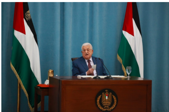
אבו מאזן נושא דברים בפתח כינוס מיוחד בראמאללה של ההנהגה הפלסטינית (ופא, 12 במאי 2021)

◀ אבו מאזן שוחח עם מלך ירדן עבדאללה השני. השניים הסכימו להמשיך את התיאום ביו הצדדים כדי לעצור את התקיפות נגד העם הפלסטיני. שיחות דומות ניהל אבו מאזן עם נשיא עיראק ברהם צאלח, תמים בן חמד, אמיר קטר, ועם ג'וזפ בורל, הנציג העליון לענייני חוץ וביטחון באיחוד האירופאי, ודן עמם בהתפתחויות האחרונות (ופא, 12 במאי 2021). כמו כן, שוחח עם אנתוני בלינקן מזכיר המדינה של ארה"ב (דניא אלוטן, 12 במאי 2021).