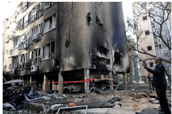
בניין המגורים בפתח תקווה שנפגע מרקטה ששוגרה מהרצועה (דף הפייסבוק של QUDSN, 13 במאי 2021)