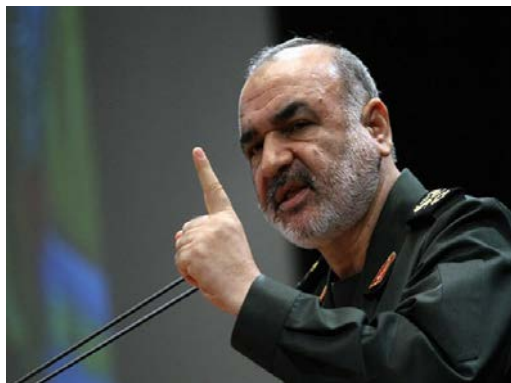
מפקד משמרות המהפכה, חסין סלאמי (אלמיאדין, 26 באפריל).

• בעקבות ההסלמה בין ישראל לפלסטינים איים מפקד משמרות המהפכה, חסין סלאמי (Hossein Salami), כי אם ימשיכו "הציונים" בפעולותיהם, יוביל הדבר בסופו של דבר לקריסתם. בריאיון לערוץ הלבנוני אלמיאדין (26 באפריל 2021), אמר סלאמי, כי פעולות "הציונים" באזור יחשפו אותם לסכנות אמיתיות בעתיד. הוא הוסיף, כי איראן תגיב לכל פעולה זדונית נגדה באותה המידה או בעוצמה חזקה יותר.