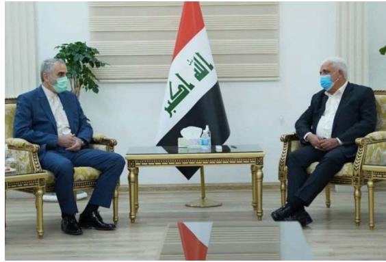
פגישת סגן שר ההגנה האיראני עם מפקד "הגיוס העממי" (אלעאלם, 21 באפריל 2021)