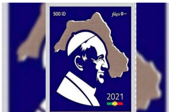
הבול שהונפק בעקבות ביקור האפיפיור בכרדיסטאן העיראקית (איסני"א, 10 במרץ 2021).