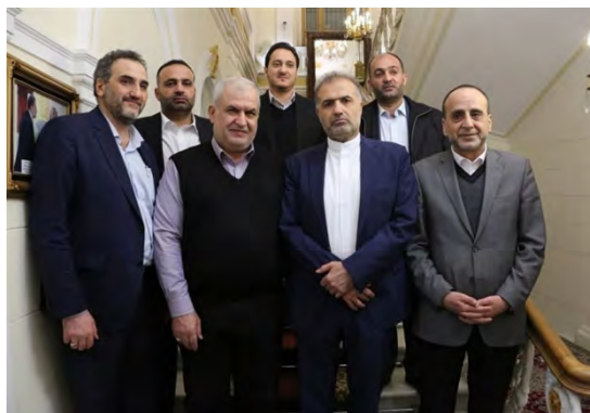
פגישת שגריר איראן במוסקבה עם חברי משלחת חזבאללה, שביקרה ברוסיה (תסנים, 16 במרץ 2021).