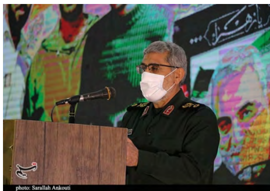
מפקד כוח קדס של משמרות המהפכה (תסנים, 12 במרץ 2021).

◀ מפקד כוח קדס של משמרות המהפכה, אסמאעיל קאא'ני, אמר בטקס זיכרון בעיר משהד ללוחמים שנהרגו במלחמת איראן-עיראק, כי למרות שכל יכולות העולם עומדות לרשות ישראל, היא נאלצה להקיף עצמה בחומה בגובה שישה מטרים וברוחב מטר אחד כדי שתרגיש בטוחה, אך על הציונים להיות בטוחים שגם חומה זו תיהרס. כמו כן, הזהיר קאא'ני את ארצות הברית מהשלכות חיסולו של קאסם סלימאני. הוא ציין, כי ארצות הברית ניצבת בפני בעיות פנימיות רבות וכי ממשיכי דרכו של קאסם סלימאני ישברו לאמריקאים את העצמות וקול שבירת העצמות יישמע בזמן הנכון (תסנים, 12 במרץ 2021).