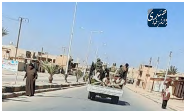
חברי מיליציה עיראקית פרו-איראנית נוסעים ברכב חקלאי מאלבוכמאל לגבול סוריה-עיראק (צדא אלשרקיה, 17 במרץ 2021)

◀ אתר החדשות הסורי האופוזיציוני צדא אלשרקיה דיווח (17 במרץ 2021), כי המיליציות הפרו-איראניות באזור אלבוכמאל החלו לאחרונה להשתמש במכוניות אזרחיות לשם העברת כוחות בין העיירות באזור זה ומגבול סוריה-עיראק ואליו. השימוש במכוניות אזרחיות (כלי רכב חקלאיים או מוניות שכורות) במקום כלי רכב צבאיים נועד למנוע את תקיפתן מן האוויר על-ידי ישראל או ארצות הברית. על-פי דיווח זה, המיליציות משלמות לבעלי הרכבים האזרחיים עבור השימוש בהם וכן מספקות להם אישורים המאפשרים להם לעבור במחסומים באופן חופשי.