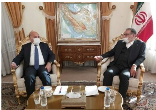
פגישת שר החוץ העיראקי עם מזכיר המועצה העליונה לביטחון לאומי של איראן (תסנים, 27 בפברואר 2021).

◀ שר החוץ העיראקי, פואד חסין (Fouad Hussein), הגיע ב-27 בפברואר 2021 לביקור בטהראן. זהו ביקורו השני באיראן בתוך פחות מחודש. במהלך הביקור נפגש חסין עם שר החוץ האיראני זריף ועם מזכיר המועצה העליונה לביטחון לאומי, עלי שמח'אני. שמח'אני אמר בפגישה, כי העיכוב במימוש החוק, שעבר בפרלמנט העיראקי וקורא לנסיגת הכוחות האמריקאים מעיראק, יגביר את המתיחות ויחריף את המשבר באזור. הוא הזהיר מפני פעילות ארצות הברית בעיראק שנועדה, לדבריו, לחזק את פעילותו הטרוריסטית של דאעש באזור, ואמר, כי התקיפה האמריקאית נגד המיליציות העיראקיות היא ראשיתו של שלב חדש ב"טרור מאורגן" (תסנים, 27 בפברואר 2021).