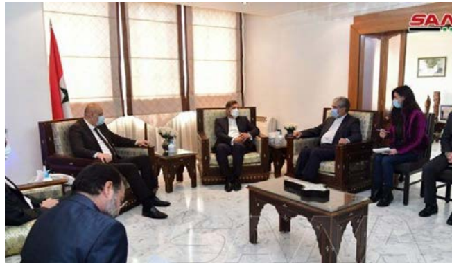
פגישת דובר משה"ח האיראני עם שר ההסברה הסורי (סאנ"א, 25 בפברואר 2021).

◀ דובר משרד החוץ האיראני, סעיד ח'טיבזאדה (Saeed Khatibzadeh), ביקר ב-24 בפברואר 2021 בסוריה ונפגש עם בכירים בממשל הסורי. בפגישה עם שר החוץ הסורי, פיצל אלמקדאד, דנו השניים בהתפתחויות באזור וביחסים הביטחוניים בין שתי המדינות ובדרכים לחזקם. ח'טיבזאדה הדגיש את החשיבות, שאיראן מייחסת ליחסיה עם סוריה, ואת תמיכתה בפתרון, ששייב את הביטחון והיציבות לסוריה תוך שמירת ריבונותה, עצמאותה ולכידותה הטריטוריאלית. בשיחה עם כתבים אמר דובר משרד החוץ האיראני, כי בכוונת איראן לשלוח לסוריה דלק וקמח כדי לסייע לעם הסורי. כמו כן, נפגש ח'טיבזאדה עם שר ההסברה הסורי, עמאד סארה (Imad Sara), ועם יועצת הנשיא הסורי, בת'ינה שעבאן, והעביר הרצאות באקדמיה הדיפלומטית ובמרכז למחקרים אסטרטגיים בדמשק (אלוטן, 25 בפברואר; פארס, 27 בפברואר 2021).