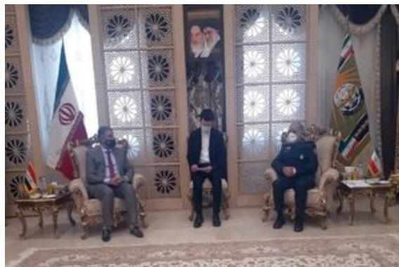
פגישת ראש אגף התיאום במטכ"ל האיראני עם יועצו הבכיר של שר הפנים העיראקי (משרק ניוז, 1 במרץ 2021).