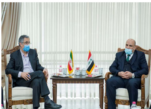
פגישת ראש לשכת המסחר והתעשייה של טהראן עם שגריר עיראק בטהראן (אתר לשכת המסחר של טהראן, 8 בפברואר 2021).

◀ שגריר עיראק הביע את נכונותו לשתף פעולה עם לשכת המסחר של טהראן על מנת לפתור את הבעיות המעכבות את הרחבת שיתוף הפעולה הכלכלי והמסחרי בין שתי המדינות. הוא ציין, כי הקשיים בהוצאת ויזות לסוחרים איראנים נובעים ממגפת הקורונה, אך ציין, כי השגרירות מוכנה להוציא ויזה מסחרית לסוחרים איראנים המוכרים על-ידי לשכת המסחר של טהראן. כמו כן, הדגיש השגריר את הצורך לקיים ירידים מסחריים משותפים בשתי המדינות (אתר לשכת המסחר והתעשייה של טהראן, 8 בפברואר 2021).