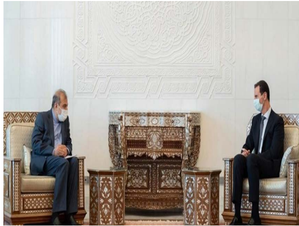
פגישת הנשיא אסד עם יועצו הבכיר של שר החוץ האיראני (פארס, 10 בפברואר 2021).

בסוריה והדגיש את הצורך בהמשך התיאומים וההתייעצויות בין שתי המדינות. במהלך ביקורו בדמשק נפגש יועצו של שר החוץ גם עם שר החוץ הסורי, פיצל מקדאד (פארס, 10 בפברואר 2021).