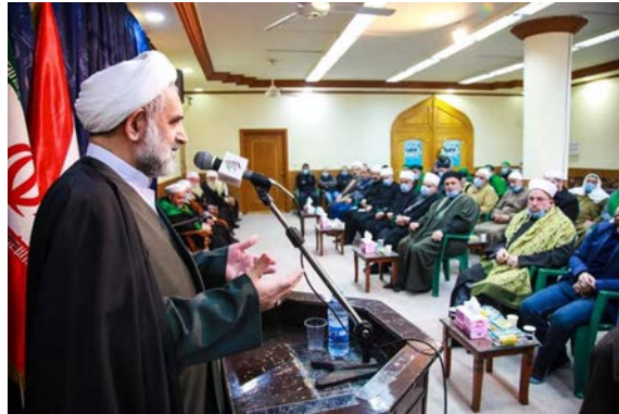
טקס יום השנה ה-42 למהפכה בראשות נציג מנהיג איראן בסוריה (אתר מנהיג איראן בערבית, 11 בפברואר 2021).