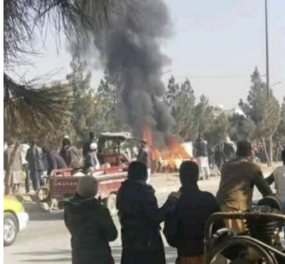
السيارة التي على ما يبدو تابعة لرجل المخابرات الأفغاني تحترق في العاصمة كابل نتيجة تفجير العبوة الناسفة (Khaama Press، 26 كانون ثاني/ يناير 2021).

◀ 26 كانون ثاني/ يناير 2021: فجر عناصر تنظيم الدولة الإسلامية عبوة ناسفة لاصقة استهدفت سيارة في العاصمة كابل. أسفرت العملية عن مقتل شخص واحد (Khaama Press، 26 كانون ثاني/ يناير 2021). تبنى تنظيم الدولة الإسلامية المسؤولية عن العملية وبحسب البيان الصادر عن تنظيم الدولة الإسلامية فقد تم تفجير عبوة ناسفة لاصقة تم تثبيتها على سيارة لأحد أفراد جهاز المخابرات الأفغاني، ما أدى إلى مقتل رجل المخابرات (تلغرام، 26 كانون ثاني/ يناير 2021).