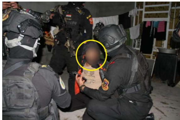
أحد عناصر تنظيم الدولة الإسلامية الذي قبض عليه أفراد الجهاز العراقي لمكافحة الإرهاب (صفحة فيسبوك الناطق باسم الجيش العراقي، يحيى رسول، 23 كانون ثاني/ يناير 2021).

◀ 23 كانون ثاني/ يناير 2021: ألقى فريق من الجهاز العراقي لمكافحة الإرهاب القبض على عنصرين من تنظيم الدولة الإسلامية كانا يعملان ضمن خلية للتنظيم، وذلك على مبعده ما يقارب بضعة عشرات الكيلومترات على الغرب وإلى الشمال الغربي من بغداد (صفحة فيسبوك الناطق باسم الجيش العراقي، يحيى رسول، 23 كانون ثاني/ يناير 2021).