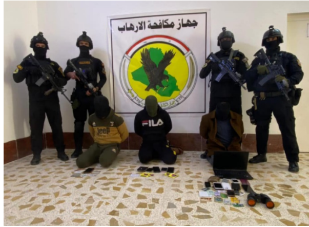
عناصر تنظيم الدولة الإسلامية الثلاثة الذين ألقى عليهم القبض في محيط مدينة هيت (صفحة فيسبوك الجهاز العراقي لمكافحة الإرهاب، 24 كانون ثاني/ يناير 2021).

◀ 24 كانون ثاني/ يناير 2021: قامت قوة من الجهاز العراقي لمكافحة الإرهاب بإلقاء القبض على ثلاثة من عناصر تنظيم الدولة الإسلامية في منطقة هيت، على مبعده ما يقارب 140 كلم إلى الشمال الغربي من بغداد. حيث ضُبطت بحوزتهم مستندات هامة (صفحة فيسبوك الجهاز العراقي لمكافحة الإرهاب، Icts، 24 كانون ثاني/ يناير 2021).