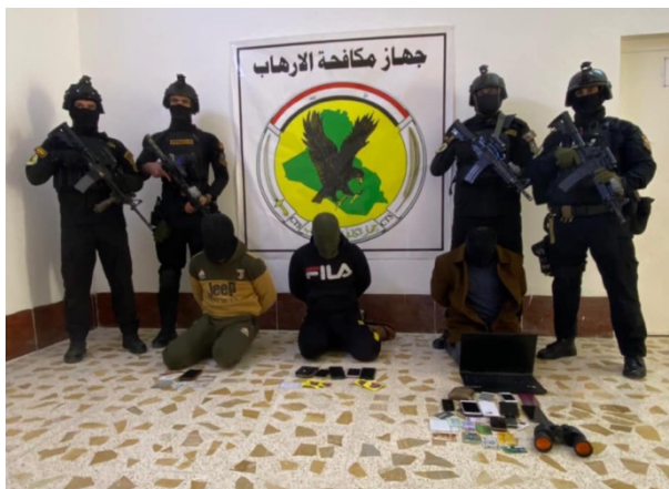
שלושה פעילי דאעש, שנלכדו באזור הית (דף הפייסבוק של המנגנון העיראקי ללוחמה בטרור, 24 בינואר 2021).

24 בינואר 2021: כוח של היחידה העיראקית ללוחמה בטרור לכד שלושה פעילי דאעש באזור הית, כ-140 ק"מ מצפון-מערב לבגדאד. בידם נתפסו מסמכים חשובים (דף הפייסבוק של המנגנון העיראקי ללוחמה בטרור, 24 בינואר 2021).