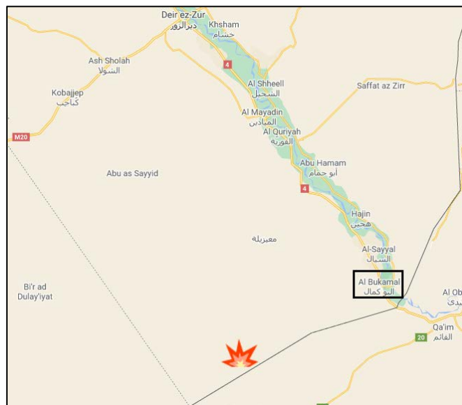
האזור בקרבת הגבול עם עיראק בו בוצעה ההתקפה ע"י דאעש (Google Maps).

◀ 25 בינואר 2021: פעילי דאעש תקפו עמדות של צבא סוריה והכוחות המסייעים לו, כארבעים ק"מ מדרום-מערב לאלבוכמאל (בקרבת גבול סוריה-עיראק). חמישה-עשר לוחמים נהרגו ועשרים נוספים נפצעו (עין אלפראת, Eye of Euphrates, 26 בינואר 2021). עד כה לא קיבל אף ארגון אחריות לביצוע הפיגוע אך ככל הנראה המדובר בדאעש.