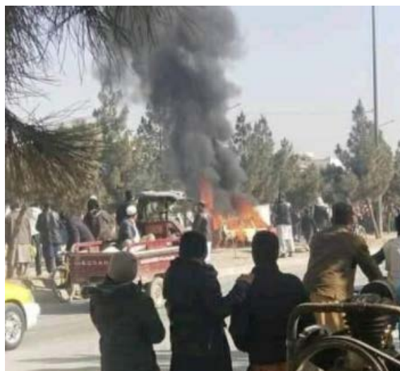
כלי רכב, כנראה של איש מודיעין אפגאני, עולה באש בעיר קאבול, לאחר שהופעל מטען עלוקה (Khaama Press, 26 בינואר 2021).

26 בינואר 2021: הופעל מטען עלוקה נגד כלי רכב בבירה קאבול. אדם אחד נהרג (Khaama Press, 26 בינואר 2021). דאעש קיבל אחריות לפיגוע על פי דיווח דאעש הופעל מטען עלוקה, שהוצמד לכלי רכב של איש מודיעין אפגאני. איש המודיעין נהרג (טלגרם, 26 בינואר 2021).