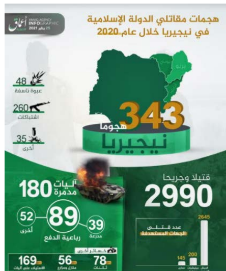
אינפוגרף המסכם את פעילות דאעש בניגריה בשנת 2020 (טלגרם, 25 בינואר 2021).

על-פי האינפוגרף, בהתקפות שבוצעו במהלך 2020 נהרגו ונפצעו 2,990 בני אדם. זוהי רמת הקטלניות הגבוהה ביותר בקרב המחוזות השונים של דאעש, גם במחוזות שבהם מתבצעות תקיפות רבות יותר (עיראק וסוריה). מספר הנפגעים הגדול ביותר היה בקרב חיילי צבא ניגריה (2,645 נפגעים), שהיווה היעד המרכזי לפעילות דאעש. לאחריהם מיליציות המסייעות לצבא ניגריה (200 לוחמים) ואוכלוסייה אזרחית נוצרית (145) (טלגרם, 25 בינואר 2021).