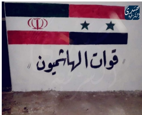
"כוחות אלהאשמיון" (חשבון הטוויטר של צדא אלשרקיה, 2 בינואר 2021).

◀ אתר החדשות הסורי האופוזיציוני צדא אלשרקיה דיווח (2 בינואר 2021) על הקמת מיליציה פרו-איראנית חדשה באלבוכמאל בשם "כוחות אלהאשמיון". על-פי הדיווח, המיליציה החדשה הוקמה על-ידי מינהלת המיליציות האיראניות בעיר וקשורה לפוג' 47, מיליציה סורית הפועלת בחסות משמרות המהפכה באזור דיר א-זור. פעילי המיליציה החדשה גויסו מקרב כוח העילית של הפוג' והם מונים חמישים לוחמים. עוד נמסר בדיווח, כי המיליציה החדשה השתלטה על כמה בתי מגורים באלבוכמאל ומיקמה בהם את מפקדותיהם.