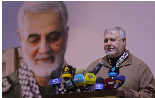
בכיר חמאס מחמוד אלזהאר (מימין) ובכיר הג'האד האסלאמי ח'אלד אלבטש (משמאל) נואמים באירוע בעזה לזכר קאסם סלימאני (פאלטודיי, 4 בינואר 2021)

◀ לקראת ציון יום השנה הוצבו ברצועת עזה שלטי חוצות בהם תמונתו של סלימאני עם הכיתוב "שהיד ירושלים". זמן מה לאחר הצבת הכרזה, הועלה ברשתות החברתיות סרטון שתיעד קבוצה של צעירים מסירים את הכרזה. מג'די אלמע'רבי, שיח' סלפי מרפיה, המתנגד להתערבות האיראנית במזרח התיכון ובפרט ברצועת עזה, קרא לקרוע ולהשחית את השלטים ואף פרסם תמונה בו הוא נראה מסיר את אחד השלטים (דף הפייסבוק של השיח מג'די אלמע'רבי, 30 בדצמבר 2020).