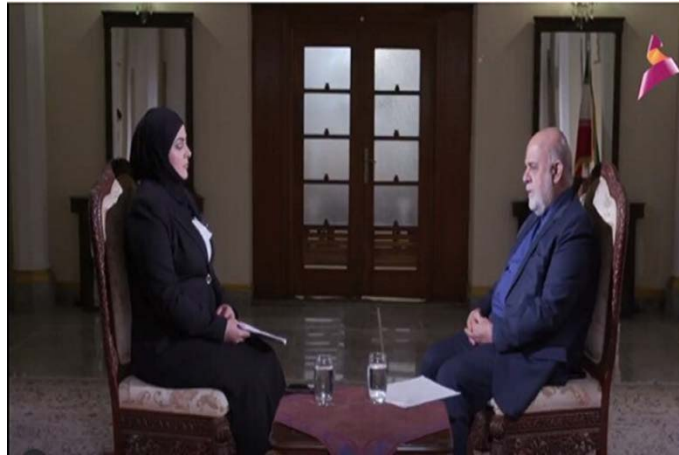
שגריר איראן בבגדאד בריאיון לערוץ הטלוויזיה העיראקי "אלעהד" (29 בדצמבר 2020).

◀ שר האנרגיה האיראני, רזא ארדאכניאן, הגיע ב-29 בדצמבר 2020 לביקור בבגדאד לצורך דיונים בנוגע לשיתוף הפעולה בין שתי המדינות בתחומי החשמל והאנרגיה ולהסדרת החובות העיראקים לאיראן בעבור יצוא חשמל וגז. קודם לביקורו של השר, הודיעה חברת הגז הלאומית של איראן על הפחתת יצוא הגז לעיראק בשל חוב עיראקי לאיראן בסך שישה מיליארד דולרים. בתום ביקורו של ארדאכניאן בבגדאד דווח על הסכמה בין שתי המדינות בנוגע להסדרת החוב ועל חידוש הזרמת הגז האיראני לעיראק (אירנ"א; תסנים, 29 בדצמבר 2020).