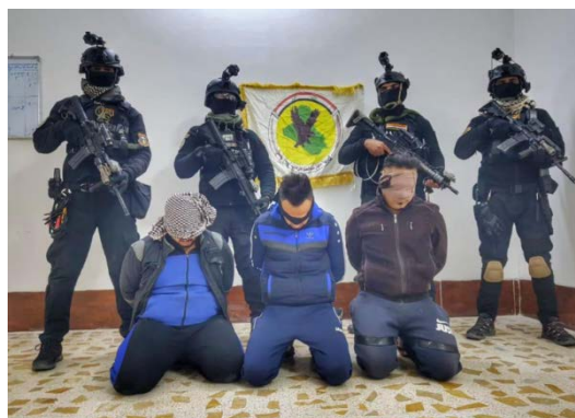
Trois membres de l'Etat islamique appréhendés par l'unité de lutte contre le terrorisme irakienne (Page Facebook de l'unité de lutte contre le terrorisme irakienne, 25 décembre 2020)

► Le 25 décembre 2020 , l'unité de lutte contre le terrorisme irakienne a arrêté trois membres de l'Etat islamique dans la région touchée (Page Facebook de l'unité de lutte contre le terrorisme irakienne, 25 décembre 2020).