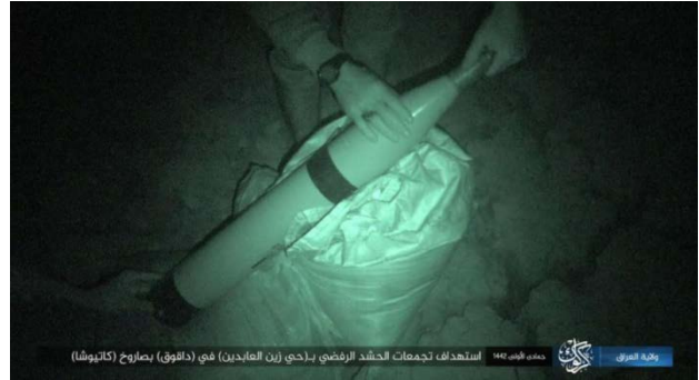
Droite : Roquette en préparation pour le tir. Gauche : Tir de roquette (Telegram, 27 décembre 2020)