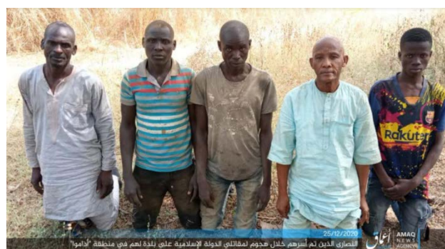
Droite : Cinq résidents chrétiens faits prisonniers par l'Etat islamique dans le village de Garkida, au Sud-Ouest de Maiduguri (Telegram, 26 décembre 2020). Gauche : Les cinq résidents chrétiens avant d'être abattus (Amaq, 29 décembre 2020).

► Le 23 décembre 2020 , des membres de l'Etat islamique ont attaqué un barrage routier de l'armée à environ 70 km au Nord de Maiduguri. Plusieurs soldats ont été tués ou blessés.