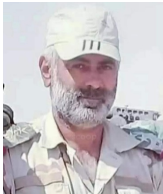
Le général de brigade Mazen Ali Hassoun tué dans les affrontements avec l'Etat islamique (Compte Twitter ALBADIA24 @ 24, 27 décembre 2020)

► Le 27 décembre 2020 , des affrontements ont eu lieu entre l'armée syrienne et des membres de l'Etat islamique dans la région désertique à l'Ouest d'Abu Kamal. Le brigadier général (au milieu) Mazen Ali Hassoun, un officier de la Garde républicaine, a été tué (Compte Twitter ALBADIA24 @ 24, 27 décembre 2020).