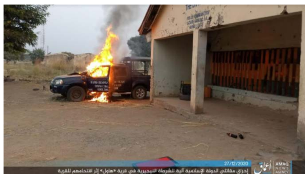
Droite : Un véhicule de la police nigérienne incendié par l'Etat islamique. Gauche : Église en flammes dans l'un des quatre villages chrétiens (Telegram, 27 décembre 2020)

► Le 25 décembre 2020 , des membres de l'Etat islamique ont échangé des tirs avec des soldats nigériens dans la partie Nord-Est de l'État de Borno. Au total, 14 soldats ont été tués et d'autres blessés. De plus, un engin piégé a été activé contre un véhicule. L'Etat islamique a saisi des armes, des munitions et quatre véhicules.