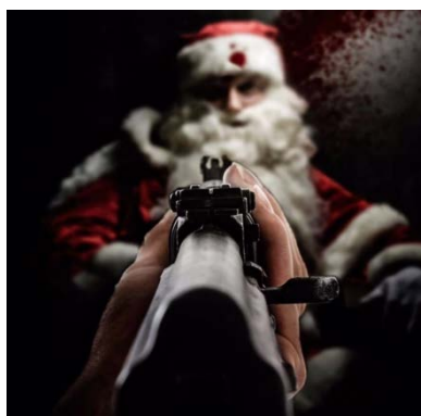
Droite : Affiche montrant un membre de l'Etat islamique tirant à mort sur le Père Noël (Compte Twitter de Vera Mironov, 23 décembre 2020). Gauche : Affiche montrant un membre de l'Etat islamique poignardant le Père Noël à mort (Compte Twitter de Vera Mironov, 23 décembre 2020). En bas : Affiche montrant un membre de l'Etat islamique tirant le Père Noël dans la tête (Compte Twitter de Vera Mironov, 23 décembre 2020)