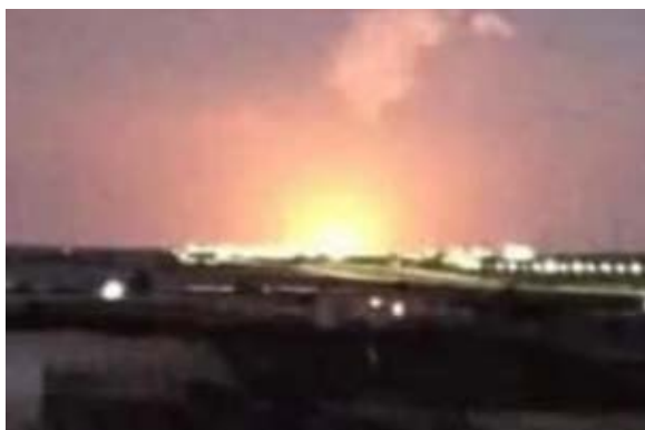
Attentat à la bombe contre un gazoduc dans la région de Sabika, à l'Ouest d'Al-Arish (Page Facebook Shahed Sinaa - al-Rasmia, 24 décembre 2020)

► Il s'agit du quatrième bombardement d'un pipeline dans cette zone en 2020. Trois des bombardements ont eu lieu récemment. Tous les attentats à la bombe ont été perpétrés par la province du Sinaï de l'Etat islamique mais n'ont pas causé de dommages importants.