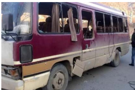
Le bus ciblé par un engin piégé de l'Etat islamique à Kaboul

des fonctionnaires du ministère afghan de la Justice à Kaboul. Selon l'allégation de responsabilité, 20 personnes ont été tuées ou blessées (Telegram, 28 décembre 2020).