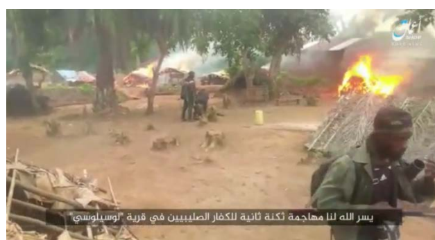
Des tentes de l'armée congolaise en flammes (28 décembre 2020)

► Le 21 décembre 2020 , des membres de l'Etat islamique ont tiré des mitrailleuses sur un complexe de l'armée congolaise dans la région de Beni. Trois soldats ont été tués. En outre, des armes et des munitions ont été saisies.