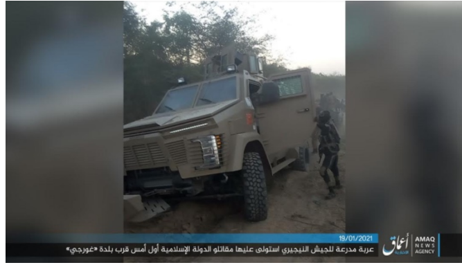
سيارة مصفحة لجيش نيجيريا استولى عليها عناصر تنظيم الدولة الإسلامية ومن ثم قاموا بإحراقها (تلغرام، 19 كانون ثاني/ يناير 2021).

◀ في 15 كانون ثاني/ يناير 2021 استولى عناصر تنظيم الدولة الإسلامية على بلدة مارتى (Marte) الواقعة على مبعده ما يقارب تسعين كلم إلى الشمال الشرقي من مدينة مايدوجوري. وعلى إثر ذلك اضطر جنود جيش نيجيريا ومعهم مئات من سكان البلدة للهروب منها. أما جيش نيجيريا فقد أعلن بأن ذلك "انسحاب تكتيكي" من البلدة وأنه قد قتل عدداً من المهاجمين (رويترز، 17 كانون ثاني/ يناير 2021). في 17 كانون ثاني/ يناير 2021 في ساعات الصباح استعاد جيش نيجيريا سيطرته على بلدة مارتى وذلك بعد خوضه معارك شرسة ضد عناصر تنظيم ولاية غرب أفريقيا التابع لتنظيم الدولة الإسلامية (Africa News، 18 كانون ثاني/ يناير 2021). في 18 كانون ثاني/ يناير 2021: صد عناصر تنظيم الدولة الإسلامية محاولة لقوة من جيش نيجيريا للتقدم باتجاه مواقع التنظيم في بلدة مارتى (Marte). ودار اشتباك بالنار بين الطرفين لمدة ساعات. كما تم تفجير عدد من العبوات الناسفة لاستهداف جنود جيش نيجيريا. وعلى حد مزاعم تنظيم الدولة الإسلامية فقد قُتل أكثر من عشرين جندياً وأصيب عدد كبير من الجنود بجروح (تلغرام، 18 كانون ثاني/ يناير 2021).