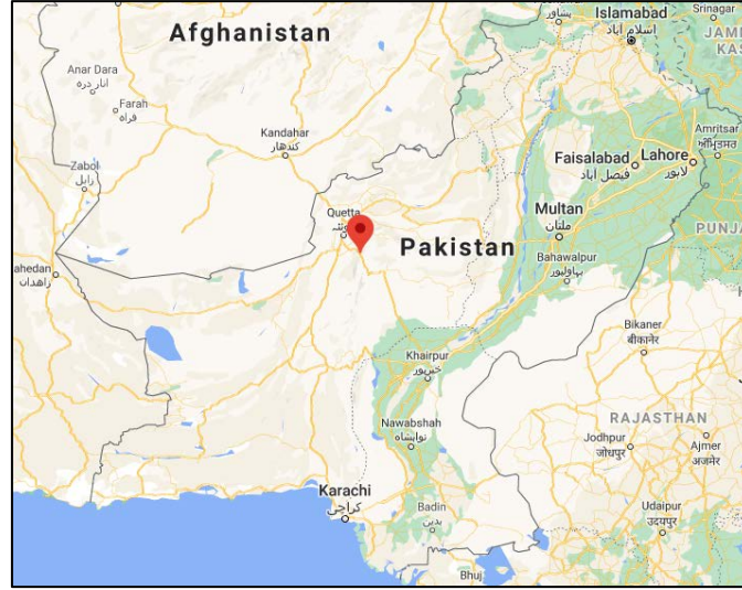
كوقع خطف عمال مناجم الفحم الشيعة (Google Maps).

◀ في 3 كانون ثاني/ يناير 2021 قام مسلحون تحت تهديد السلاح بخطف ما لا يقل عن أحد عشر من عمال مناجم الفحم الحجري من أبناء قبيلة هزارا (Hazara) (وهي أقلية عرقية معظمها من الشيعة) بالقرب من موقع للتنقيب عن الفحم الحجري يقع على مبعده ما يقارب ستين كلم إلى الجنوب الشرقي من قويتا (Quetta)، عاصمة إقليم بلوشستان (Hindustan Times، 3 كانون ثاني/ يناير 2021; DW (Deutsche Welle)، 3 كانون ثاني/ يناير 2021).