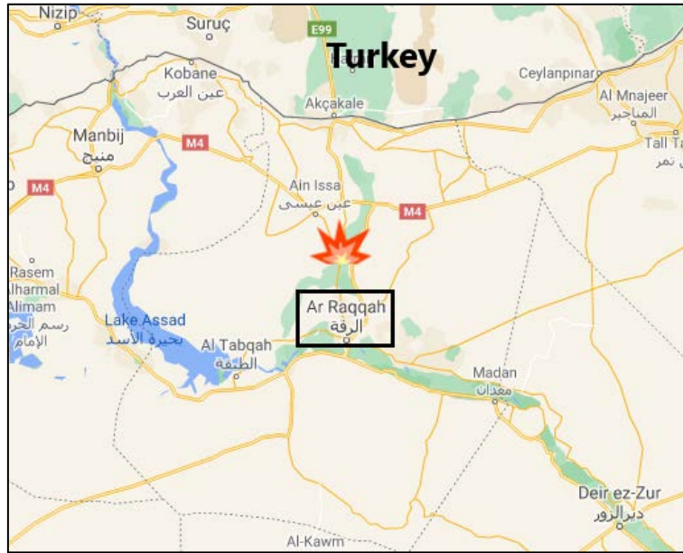
بلدة تل السمن، على الشمال من الرقة، حيث تم الهجوم على قاعدة الجيش السوري (تظهر عليها علامة انفجار) (Google Maps).

◀ في 1 كانون ثاني/يناير 2021 انفجرت سيارة ملغمة عند مدخل قاعدة روسية في بلدة تل السمن، على مبعدة ما يقارب ثلاثة كلم إلى الشمال من مدينة الرقة. وبعد ذلك كان هناك إطلاق نار عنيف على عدد من سيارات الإسعاف التي هرعت إلى القاعدة. أفادت التقارير عن مقتل خمسة من عناصر تنظيم "حُرّاس الدين" خلال العملية إلى جانب إصابة اثنين من الروس (جنود روسيين) بجروح (Kurdistan24، 1 كانون ثاني/يناير 2021). تبني تنظيم "حُرّاس الدين" (الموالي لتنظيم القاعدة) المسؤولية عن تنفيذ العملية، وهي العملية الأولى من نوعها التي ينفذها التنظيم في هذه المنطقة (حساب تويتر ش.ب.أ.س.أ.م.ة@elbYxqJUjlk41FY، الموالي لتنظيم القاعدة، 1 كانون ثاني/يناير 2021).