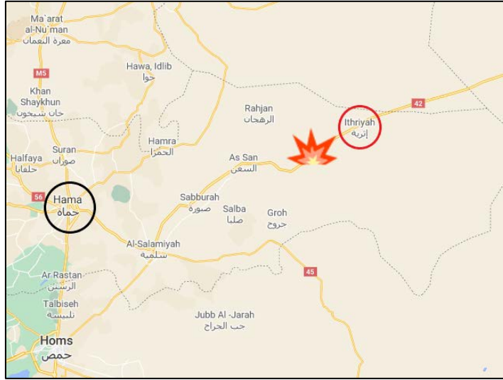
موقع الكمين الذي استهدف شاحنات نقل النفط.