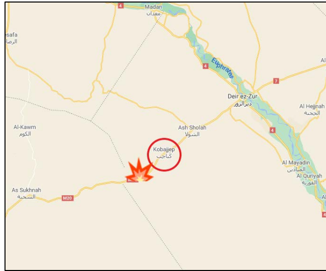
موقع استهداف الحافلة (Google Maps).

◀ في 30 كانون أول/ ديسمبر 2020: استهداف عناصر تنظيم الدولة الإسلامية حافلة تنقل المدنيين على الشارع السريع بين تدمر ودير الزور، على مبعده ما يقارب خمسين كلم إلى الجنوب الغربي من دير الزور. وبحسب الإفادات الصادرة عن النظام السوري فقد أسفرت العملية عن مقتل 25 مواطناً وإصابة 13 بجروح . فيما تحدثت مصادر من المعارضة السورية عن سقوط 39 قتيلاً (المرصد السوري لحقوق الإنسان ، 31 كانون أول/ ديسمبر 2020; سانا، 30 كانون أول/ ديسمبر 2020).