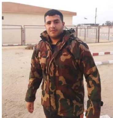
الرقيب في الجيش المصري الذي قُتل من جراء انفجار العبوة الناسفة (صفحة فيسبوك شاهد سيناء - الرسمية ، 1 كانون ثاني/ يناير 2021).