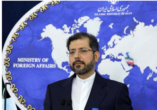
דובר משרד החוץ האיראני (תסנים, 21 בדצמבר 2020)

והצהרה המידית מצד מזכיר המדינה האמריקאי בעקבותיה חשודים ונראה שהתגובה האמריקאית הוכנה מראש. ח'טיבזאדה הזהיר את הממשל האמריקאי, שלא להצית את האש בימים אלה (תסנים, 21 בדצמבר 2020). בעקבות הירי לעבר מתחם השגרירות האמריקאית, שלא גרם לנפגעים בנפש, הטיל מזכיר המדינה האמריקאי, מייק פומפאו, את האחריות למתקפה על המיליציות העיראקיות הנתמכות על-ידי איראן. ב-23 בדצמבר 2020 הטיל נשיא ארצות הברית טראמפ על איראן את האחריות לשיגור הרקטות לעבר השגרירות בבגדאד והזהיר בציוץ בחשבון הטוויטר שלו, כי אם אמריקאי אחד ייהרג, הוא יראה באיראן אחראית לכך.