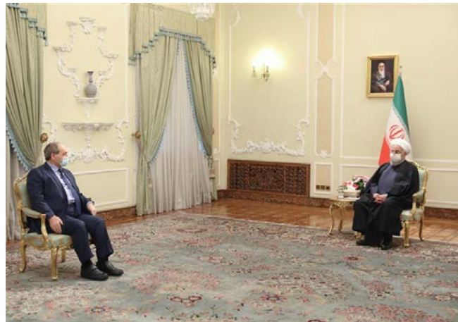
פגישת הנשיא רוחאני עם שר החוץ הסורי (תסנים, 8 בדצמבר 2020).

◀ הנשיא רוחאני הדגיש בפגישתו עם שר החוץ הסורי את תמיכתה הנמשכת של איראן ב"בעלת בריתה האסטרטגית", סוריה "עד לניצחון הסופי". הוא ציין, כי המאבק ב"כובשים הציונים" ובטרור הוא יעד משותף לשתי המדינות (תסנים, 8 בדצמבר).