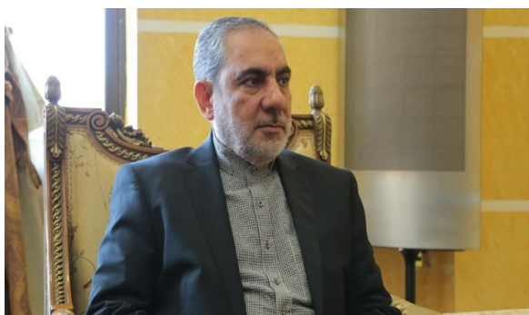
חסן אירלו, שגריר איראן בתימן (פארס, 9 בדצמבר 2020).

◀ משרד האוצר האמריקאי הודיע על הטלת סנקציות על שגריר איראן בתימן, חסן אירלו (Hassan Irlu) (רויטרס, 8 בדצמבר). אירלו, שהשתייך בעבר לכוח קדס של משמרות המהפכה, מונה כשגריר החדש של איראן בתימן בסוף אוקטובר 2020. קודם למינויו כשגריר שימש אירלו במשך חמש שנים כסגנו לענייני תימן של יועצו המיוחד של שר החוץ האיראני (אלעאלם, 27 באוקטובר). בתגובה להודעת ארצות הברית, הודיע משרד החוץ האיראני על הטלת סנקציות על שגריר ארצות הברית בתימן (פארס, 9 בדצמבר).