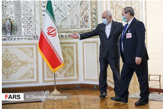
פגישת שרי החוץ של איראן וסוריה (פארס, 7 בדצמבר 2020).

האיראני, מחסן פח'ריזאדה, הודה לאיראן על תמיכתה בסוריה במערכה נגד "הטרור והקיצוניות" וגינה את פעילות ארצות הברית באזור (פארס, 7 בדצמבר).