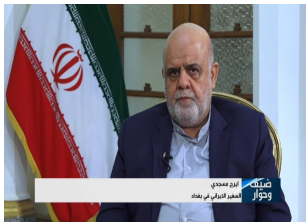
שגריר איראן בבגדאד, אירג' מסג'די.

◀ שגריר איראן בבגדאד, אירג' מסג'די, אישר בריאיון לערוץ הטלוויזיה "אלעאלם" (5 בדצמבר), את דבר ביקורו לאחרונה של מפקד כוח קדס של משמרות המהפכה, אסמאעיל קאא'ני, בעיראק. מסג'די ציין, כי קאא'ני נפגש עם ראש ממשלת עיראק, מצטפא אלכאט'מי; עם נשיא עיראק, ברהם צאלח; ועם כמה בכירים עיראקים נוספים ודן עימם בסוגיות מדיניות, ביטחוניות וכלכליות ובחזוק שיתוף הפעולה הביטחוני בין שתי המדינות. הוא הדגיש, כי איראן אינה מתערבת בעניינים הפוליטיים הפנימיים בעיראק, אך ציין, כי קיימים קשרים טובים בין הסיעות העיראקיות ואיראן וטבעי הדבר שהן יקיימו עימה התייעצויות. פעילות איראן בעיראק לא נועדה, לדבריו, להחליש את הממשלה, אלא דווקא לחזק אותה ואת שיתוף הפעולה והאחדות בין הקבוצות הפוליטיות והעדות השונות במדינה. מסג'די הזהיר מפני פעולה צבאית אמריקאית נגד המיליציות השיעיות בעיראק ואמר, כי פעולה אמריקאית נגד "קבוצות ההתנגדות" תיענה בתגובה חריפה מצד קבוצות אלה.