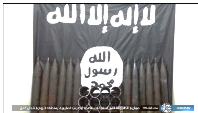
Les 12 roquettes tirées par l'Etat islamique sur la base aérienne de Bagram (Telegram, 19 décembre 2020)

► Le matin du 19 décembre 2020 , cinq roquettes tirées de véhicules ont touché la base aérienne militaire de Bagram, à environ 40 km au Nord de Kaboul. La police de Kaboul a réussi à désactiver sept autres roquettes avant qu'elles ne soient tirées. Il n'y a eu aucune victime (Afghanistan Times, 19 décembre 2020). L'Etat islamique a revendiqué la responsabilité. Selon sa revendication de responsabilité, 12 roquettes ont été tirées sur la base aérienne, où sont stationnés des soldats américains (Telegram, 19 décembre 2020).