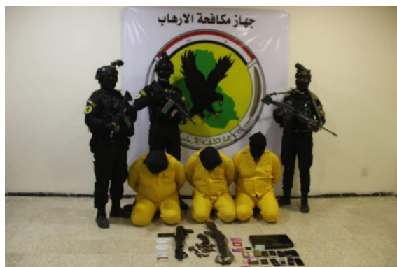
Trois membres de l'Etat islamique détenus par l'appareil de lutte contre le terrorisme irakien (Page Facebook de l'Unité de lutte contre le terrorisme irakienne, 19 décembre 2020)

► Le 19 décembre 2020 , les forces de l'Unité de lutte contre le terrorisme irakien ont arrêté trois membres de l'Etat islamique dans le district de Hawija, à environ 60 km au Sud-Ouest de Kirkouk (Page Facebook de l'Unité de lutte contre le terrorisme irakienne, 19 décembre 2020).