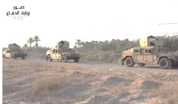
כוחות צבא עיראק במהלך המבצע נגד דאעש מצפון-מזרח לבעקובה (דף הפייסבוק של משרד ההגנה העיראקי, 1 בנובמבר 2020).