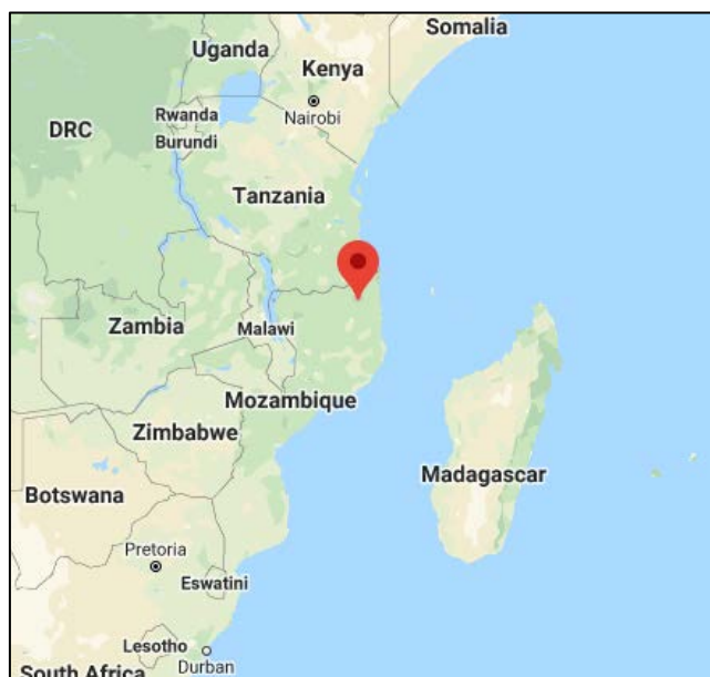
אזור כאבו דלגאדו (Google Maps).

ברנדינו רפאל (Bernadino Rafael), מפקד משטרת מוזמביק, הודיע, כי בין 26-29 באוקטובר 2020, הרגו כוחות הביטחון של מוזמביק שמונים ותשעה "פעילי טרור אסלאמיסטים" (במשתמע, דאעש), במהלך מבצעים שניהלו במחוז כאבו דלגאדו (שבו פעיל דאעש). במסגרת הפעילות תקפו כוחות הביטחון של מוזמביק מתחם של "פעילי טרור" (במשתמע, דאעש), בעיר מוסימבואה דה פראיה, (Mocímboa da Praia), בצפון-מזרח מוזמביק (29 באוקטובר 2020). תשעה-עשר "פעילי טרור" הופתעו ונהרגו במקום. בתקיפה נגד אותו מתחם הושמדו ששה מחנות, 15 כלי רכב, 20 אופנועים וכן שלושה טון של אספקת מזון. עלה ל-108 מספר פעילי הטרור שנהרגו במחוז כאבו-דלגאדו במהלך שלושה ימים (allAfrica, 30 באוקטובר 2020).