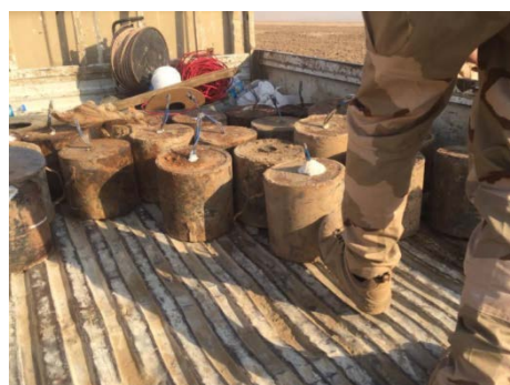
פצצות מרגמה ופגזים, שאותרו על-ידי צבא עיראק ממערב למוצול (דף הפייסבוק של משרד ההגנה העיראקי, 31 באוקטובר 2020).