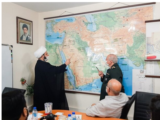
פגישת אכרם אלכעבי עם יועצו הצבאי הבכיר של מנהיג איראן (מהר, 27 באוקטובר 2020).

וביטחוניים כדי להוביל אותה לכיוון הרס וחוסר יציבות. צפוי קרא בפגישה להעמקת הקשרים בין שתי המדינות וציין, כי ארצות הברית מעוניינת בניתוק הקשרים בין עיראק לאיראן ובהחלפתם בקשרים עם ירדן, עם ערב הסעודית ואף עם ישראל. הוא ציין, כי נוכחות ארצות הברית בכל מקום בעולם הביאה רק לחוסר ביטחון, לחוסר יציבות ולטרור וכי עיראק היא דוגמא מובהקת לכך (אירנ"א, 27 באוקטובר). במהלך ביקורו בטהראן נפגש אלכעבי גם עם סגן מפקד משמרות המהפכה, עלי פדוי (Ali Fadavi), שהצהיר, כי האמריקאים מבינים רק את שפת הכוח (shafaqna, 27 באוקטובר).