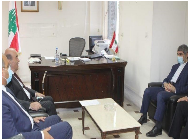
פגישת שגריר איראן בבירות עם שר החוץ הלבנוני (תסנים, 20 באוקטובר 2020)

◀ שגריר איראן בלבנון, מחמד ג'לאל פירוזניא (Mohammad Jalal Firouznia), נפגש ב-20 באוקטובר עם שר החוץ הלבנוני, שרבל והבה, ודן עימו בקשרים בין שתי המדינות, בהתפתחויות בלבנון ובאזור ובסיוע האיראני לשיקום האזורים, שנפגעו בפיצוץ בנמל בירות באוגוסט 2020. פירוזניא אמר, כי לא ניתן לקטוע את הקשרים התרבותיים, המדיניים והכלכליים העמוקים בין איראן ולבנון. הוא הדגיש, כי איראן ניצבה תמיד לצד העם והממשלה בלבנון וכי ההתנגדות מהווה מכנה משותף תמידי וייחודי עבור שתי המדינות. פירוזניא הוסיף, כי איראן מוכנה לשתף פעולה עם לבנון גם בתחום הצבאי. שר החוץ הלבנוני הצהיר, כי לבנון תמיד מקדמת בברכה את הרחבת הקשרים בין שתי המדינות (אתר רשות השידור האיראנית, 20 באוקטובר).