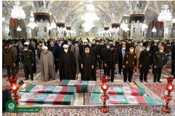
טקס ההלוויה בעיר משהד של לוחמי משמרות המהפכה, שגופותיהם אותרו וזוהו באזור ח'אן טומאן (משרק ניוז (Mashregnews), 12 באוקטובר 2020).

◀ האחראי לענייני חללי מלחמה במשמרות המהפכה, אבו-אלקאסם שריפי (Abolqasem Sharifi), עדכן ב-11 באוקטובר 2020, כי גופותיהם של שמונה לוחמי משמרות המהפכה, שנהרגו באזור העיירה ח'אן טומאן שמדרום-מערב לחלב, אותרו וזוהו באמצעות בדיקות DNA. הוא ציין, כי הגופות אותרו על-ידי צוות חקירה של משמרות המהפכה, שפעל באזור במשך מספר חודשים, והוחזרו לאיראן (אילנ"א, 11 באוקטובר 2020).