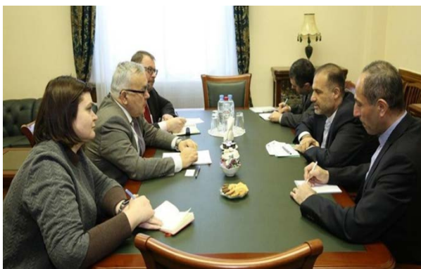
פגישת שגריר איראן במוסקבה עם סגן שר החוץ הרוסי (פארס, 13 באוקטובר 2020)

◀ שגריר איראן ברוסיה, כאט'ם ג'לאלי (Kazem Jalali), נפגש ב-12 באוקטובר 2020 עם סגן שר החוץ הרוסי, סרגיי ורשנין, ודן עמו בהתפתחויות בסוריה ובאזור וביחסים בין שתי המדינות. במהלך הפגישה דנו השניים במצב באדלב, בהמשך תהליך ההסדרה בסוריה, בסוגיית הפליטים הסורים ובתיק הנשק הכימי של סוריה. השניים הדגישו את הצורך בהמשך ההתייעצויות ושיתוף הפעולה בין מוסקבה וטראן סביב ההתפתחויות באזור. בתוך כך, אמר דובר משרד החוץ האיראני, סעיד ח'טיבזאדה (Saeed Khatibzadeh), במסיבת העיתונאים השבועית שלו, כי תהליך אסטנה להסדרה בסוריה נמשך וכי פגישת נציגי איראן, רוסיה ותורכיה, ככל הנראה בדרג סגני שרי חוץ, צפויה להתכנס עד סוף אוקטובר כדי לדון במצב באדלב ובמזרח פרת ובענייני החוקה (פארס, 13 באוקטובר 2020).