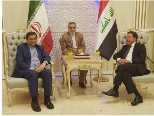
פגישת נגידי הבנקים המרכזיים של איראן ועיראק (תסנים, 12 באוקטובר 2020)

◀ שר התחבורה העיראקי, חסין בנדר אלשבלי (Hussein Bandar Al-Shibli), הודיע על חידוש הטיסות בין איראן ועיראק החל מ-12 באוקטובר 2020. הטיסות יחודשו בין בגדאד ונג'ף לטהראן ולמשהד תוך שמירה על הנחיות הבריאות לנוכח התפרצות הקורונה (איסנ"א, 11 באוקטובר 2020). כלל הטיסות בין עיראק לאיראן בוטלו החל מ-25 בספטמבר על רקע הגידול בשיעור התחלואה בקורונה מאיראן ומאמצי שלטונות עיראק למנוע את הגעתם בדרך האוויר של עולי רגל איראנים לטקסי הארבעין (העלייה לרגל למקומות הקדושים השיעים בעיראק בסיום ימי האבלות על מותו של האמאם השיעי חוסיין).