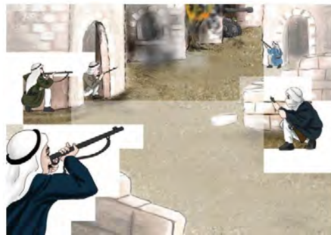
(השפה הערבית, כתיב ה', חלק ב' (2017) עמ' 73)