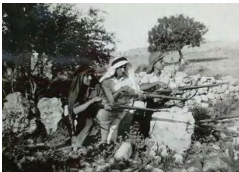
(השפה הערבית, כתיב ה', חלק ב' (2019) עמ' 73)

◆ תיקון מסוג אחר נעשה בתיאור קרב הקסטל ב-1948, כשבספר הקודם מופיע איור של לוחמים ערביים מול טנק ישראלי, בניגוד למה שהיה במציאות. במהדורת 2019 של אותו קטע מוחלף איור זה בצילום של לוחמים ערבים בעמדתם: