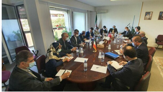
פגישת משלחת איראן בראשות יועץ שר החוץ עם משלחת תורכיה בראשות סגן שר החוץ (מהר, 24 באוגוסט 2020).

הסורית ללא התערבות זרה, בהמשך שיתוף הפעולה בין שלוש המדינות המשתתפות בשיחות אסטנה ובצורך להגיע לפתרון פוליטי בסוריה תוך שמירת ריבונותה הלאומית, אחדותה ולכידותה הטריטוריאלית (איסנ"א, 24 באוגוסט). ב-17 באוגוסט נפגש ח'אג'י בדמשק עם נשיא סוריה ושר החוץ הסורי ודן עימם בהמשך שיתוף הפעולה בין שלוש הערבות בתהליך אסטנה.