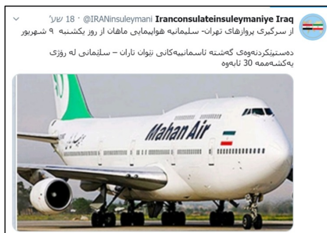
הודעת הקונסוליה האיראנית בסלימאניה על חידוש הטיסות מטהראן לעיר

◀ הקונסוליה האיראנית בסלימאניה שבכורדיסטאן העיראקית הודיעה רשמית על חידוש טיסות חברת "מאהאן אייר" מטהראן לסלימאניה החל מיום ראשון, 30 באוגוסט, לאחר הפסקה של שישה חודשים בשל התפרצות הקורונה. על-פי הודעת הקונסוליה, תפעיל החברה טיסה אחת בשבוע (איסנ"א, 28 באוגוסט). במחצית אוגוסט הודיעה חברת "מאהאן אייר" על כוונתה לחדש את הטיסות לחמישה יעדים בעיראק: בגדאד, נג'ף, בצרה, ארביל וסלימאניה.