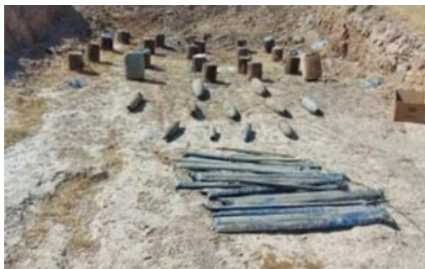
Armes de l'Etat islamique saisies dans la province de Kirkouk (Al-Sumaria, 9 août 2020)

► Le 9 août 2020 , les forces de sécurité irakiennes ont localisé un dépôt d'armes de l'Etat islamique dans la province de Kirkouk. Des engins piégés, des armes et des munitions ont été trouvés (Al-Sumaria, 9 août 2020).