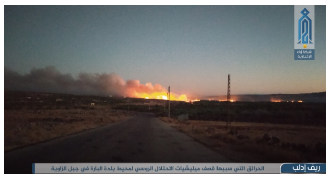
Droite : Incendies causés par l'artillerie tirée sur la zone de Jabal al-Zawiya par des milices soutenant l'armée syrienne (Ibaa, 7 août 2020). Gauche : Tir d'artillerie du Siège de Libération d'Al-Sham sur les positions d'artillerie des milices soutenant l'armée syrienne au Sud d'Idlib (Ibaa, 7 août 2020)