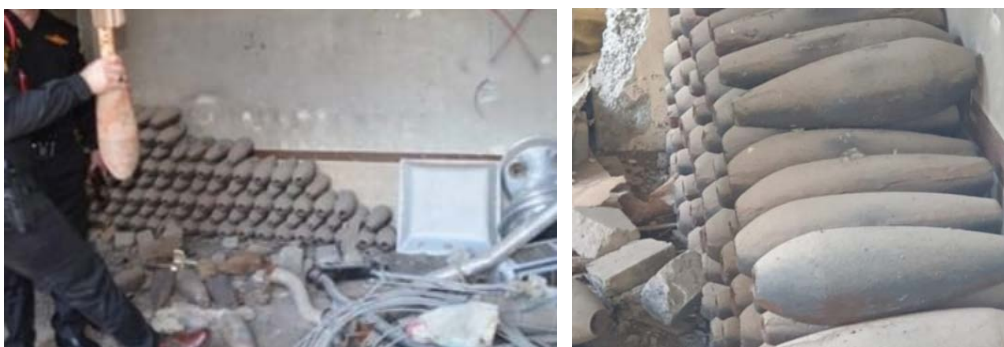
Obus de mortier trouvés dans l'atelier (Al-Sumaria, 9 août 2020)