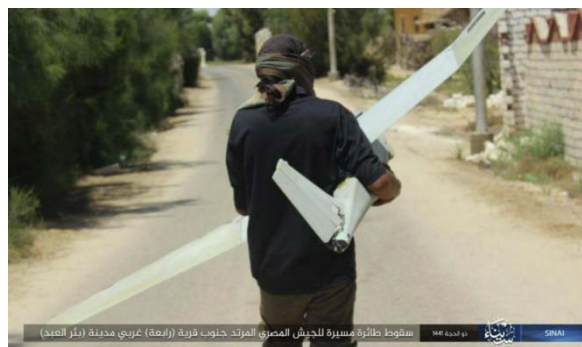
Drone abattu par des membres de l'Etat islamique (Telegram, 9 août 2020)