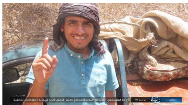
Les deux terroristes qui ont fait exploser les voitures piégées. Droite : Karar al-Maqdisi 4 . Gauche : Abu Sanad al-Ansari