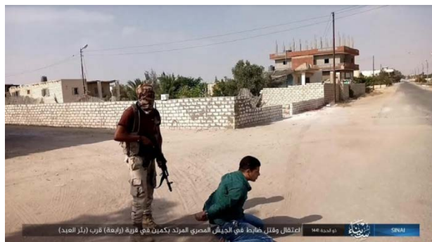
Exécution de l'officier égyptien par un membre de l'Etat islamique (Telegram, 28 juillet 2020)