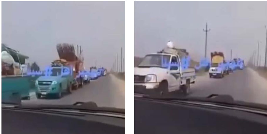
Résidents fuyant les villages repris par l'Etat islamique (Youtube, 27 juillet 2020)

► Selon un rapport, des membres de l'Etat islamique ont agité des drapeaux de l'Etat islamique à l'entrée des villages qu'ils avaient repris. Certains habitants ont accepté les appels de l'armée égyptienne et ont quitté les villages, mais de nombreuses familles sont restées chez elles. Les membres de l'Etat islamique ont commencé à communiquer avec les habitants. Ils ont distribué des bonbons aux enfants, organisé un repas commun avec les habitants du village de Qatia et leur ont demandé d'observer leur routine quotidienne. Les agents ont demandé à certains des jeunes de ne pas fumer, au motif que cela était interdit (selon l'interprétation extrême de l'islam par l'Etat islamique) (Site Internet Mada Masr, 27 juillet 2020).