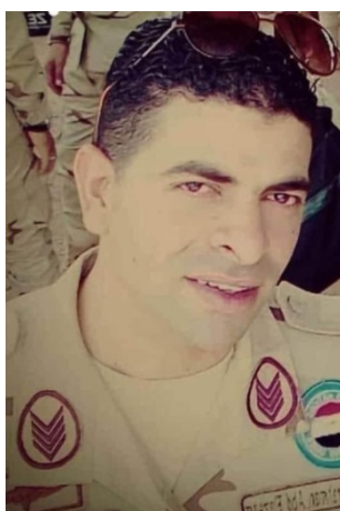
Le soldat égyptien enlevé puis exécuté (Page Facebook Shahed Sinaa - Al-Rasmia, 23 juillet 2020)

► Le 23 juillet 2020 , un soldat égyptien ayant le grade de sergent-major a été enlevé à un poste de contrôle et exécuté peu de temps après (Page Facebook Shahed Sinaa - Al-Rasmia; Al-Masry al-Youm, 23 juillet 2020). À ce jour, aucune organisation n'a revendiqué la responsabilité de l'enlèvement, mais celui-ci a apparemment été commis par l'Etat islamique.