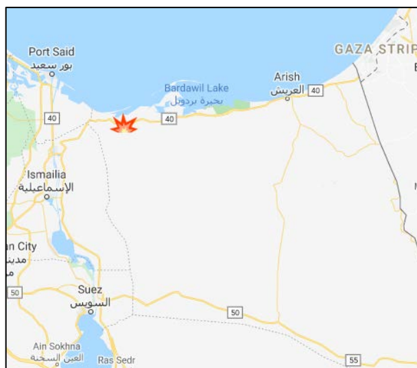
Le site de l'attaque près du village de Rabi'a , près de l'autoroute côtière à l'Ouest de Bir al-Abd