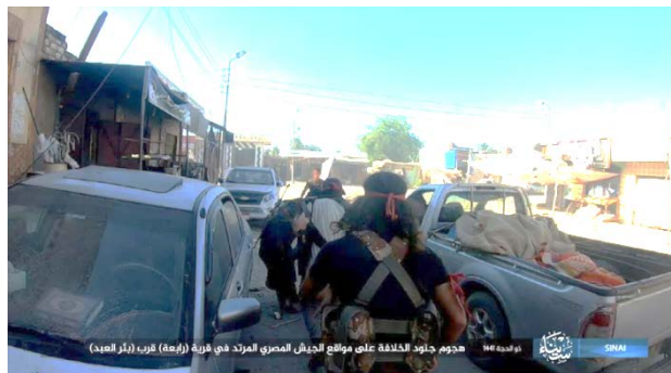
Droite : Des membres de l'Etat islamique en route pour attaquer un camp de l'armée égyptienne et des positions dans le village de Rabi'a. Gauche : Incendie à la suite de l'explosion de l'une des voitures piégées (Telegram, 28 juin 2020)