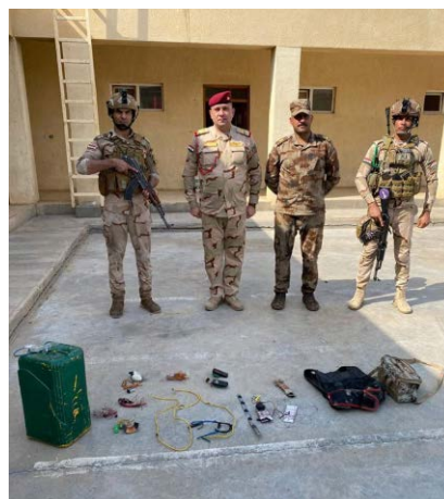
Ceinture d'explosifs et explosifs saisis par les forces de sécurité irakiennes