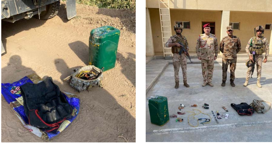
الأحزمة الناسفة والمعدات التفجيرية التي ضبطتها قوات الأمن العراقية في المخبأ (صفحة فيسبوك وزارة الدفاع العراقية، 26 تموز/ يوليو 2020).

◀ 26 تموز/ يوليو 2020: قوات الأمن العراقية العاملة بالتعاون مع قوة من الحشد الشعبي عثرت على مخبأ لعناصر تنظيم الدولة الإسلامية في محيط خانقين، على مسافة ما يقارب مائة كلم إلى الشمال الشرقي من بعقوبة. وعثرت القوات داخل المخبأ على مواد لتصنيع العبوات الناسفة وأحزمة الناسفة ومعدات تفجيرية (صفحة فيسبوك وزارة الدفاع العراقية، 26 تموز/ يوليو 2020).