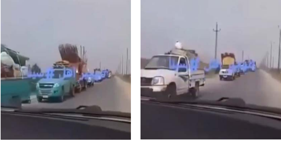
سكان القرى التي سيطر عليها عناصر تنظيم الدولة الإسلامية يفرون منها (يوتيوب، 27 تموز/ يوليو 2020).

◀ وجاء في أحد التقارير أن عناصر تنظيم الدولة الإسلامية رفعوا رايات التنظيم على مداخل القرى التي سيطروا عليها. استجاب قسم من سكان القرى لنداء الجيش المصري وغادروا القرى لكن عائلات كثيرة ظلت في بيوتها. بدأ عناصر تنظيم الدولة الإسلامية بالاتصال مع السكان. فوزعوا الحلوى على الأطفال وأقاموا وليمة مع السكان في قرية قاطيه وطلبوا منهم ممارسة حياتهم الاعتيادية. طلب عناصر التنظيم من بعض الشباب الامتناع عن التدخين لأن التدخين مُحرم (بحسب التفسير المتشدد للإسلام من وجهة نظر لتنظيم الدولة الإسلامية) (موقع إنترنت مدى مصر، 27 تموز/ يوليو 2020).