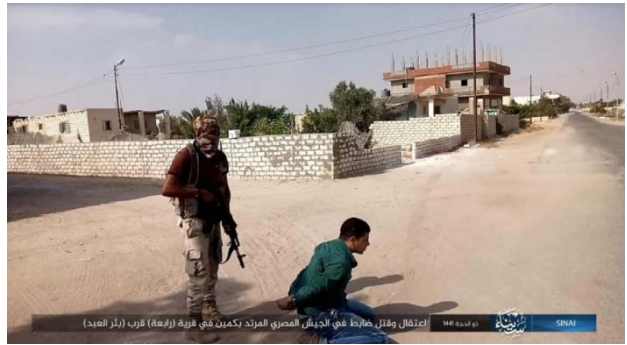
اعتقال وقتل ضابط في الجيش المصري المرشد بكمين في قرية (رابعة) قرب (بئر العبد)

أحد عناصر تنظيم الدولة الإسلامية يقوم بإعدام الضابط المصري (تلغرام، 28 تموز/ يوليو 2020).