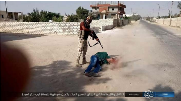
اعتقال وقتل ضابط في الجيش المصري المرشد بكمين في قرية (رابعة) قرب (بئر العبد)

◀ في 25 تموز/ يوليو 2020، وأثناء الأحداث في محيط رابعة، خطف عناصر تنظيم الدولة الإسلامية ضابطاً مصرياً على شارع القنطرة - العريش (صفحة فيسبوك شاهد سيناء - الرسمية، 25 تموز/ يوليو 2020).. تم إعدام الضابط. تم تسجيل عملية الخطف والإعدام في شريط مصور وتم نشرها على قناة يوتيوب. ويأتي تسجيل عملية الخطف بتقديرنا لبث الرعب في نفوس قوات الأمن المصرية ولتعظيم هيبة تنظيم الدولة الإسلامية في أوساط السكان المحليين (تلغرام، 28 تموز/ يوليو 2020).