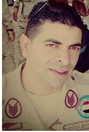
الجندي المصري الذي تم خطفه وإعدامه.

◀ في 23 تموز/ يوليو 2020 تم خطف جندي مصري برتبة رقيب أول من أحد حواجز الجيش المصري وتم إعدامه بعد خطفه بمدة قصيرة (صفحة فيسبوك شاهد سيناء - الرسمية، المصري اليوم، 23 تموز/ يوليو 2020). لم يتبن أي تنظيم حتى الآن المسؤولية عن تنفيذ عملية الخطف لكن على ما يبدو فإن هذه العملية من تدبير وتنفيذ تنظيم الدولة الإسلامية.