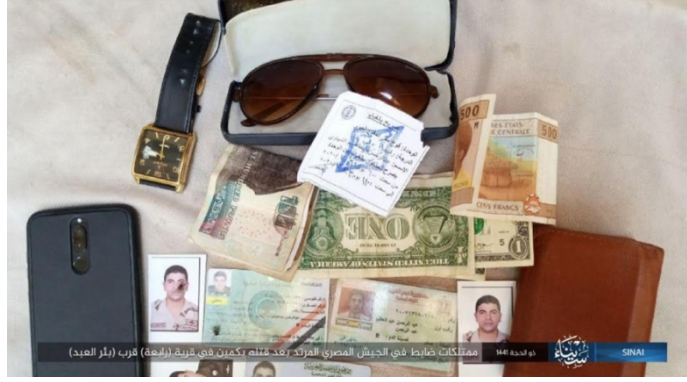
أوراق ثبوتية وهاتف ذكي وأوراق نقدية كانت بحوزة الضابط المصري الذي تم إعدامه (تلغرام، 28 تموز/ يوليو 2020).

◀ في 23 تموز/ يوليو 2020 تم خطف جندي مصري برتبة رقيب أول من أحد حواجز الجيش المصري وتم إعدامه بعد خطفه بمدة قصيرة (صفحة فيسبوك شاهد سيناء - الرسمية، المصري اليوم، 23 تموز/ يوليو 2020). لم يتبن أي تنظيم حتى الآن المسؤولية عن تنفيذ عملية الخطف لكن على ما يبدو فإن هذه العملية من تدبير وتنفيذ تنظيم الدولة الإسلامية.