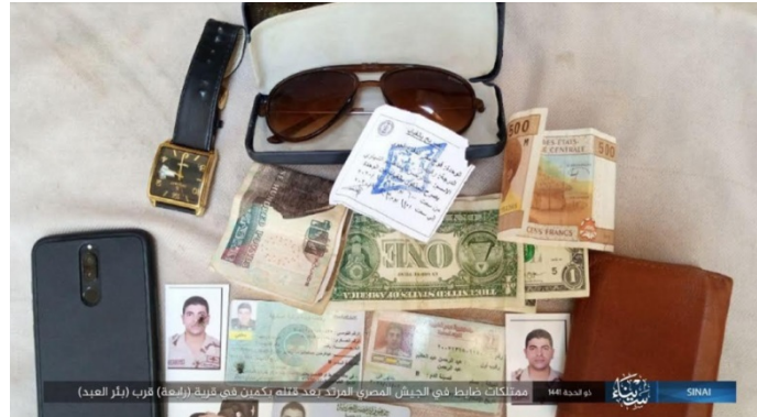
מסמכי זיהוי, סמארטפון וכסף מזומן שהיו ברשות הקצין המצרי, שהוצא להורג (טלגרם, 28 ביולי 2020).

ב-23 ביולי 2020 נחטף חייל מצרי בדרגת רס"ל מאחד המחסומים והוצא להורג זמן קצר לאחר מכן (דף הפייסבוק שאהד סינאא' - אלרסמיה, אלמצרי אליום, 23 ביולי 2020). עד כה לא קיבל ארגון כלשהו אחריות לביצוע החטיפה, אך ככל הנראה נראה כי מדובר בדאעש.