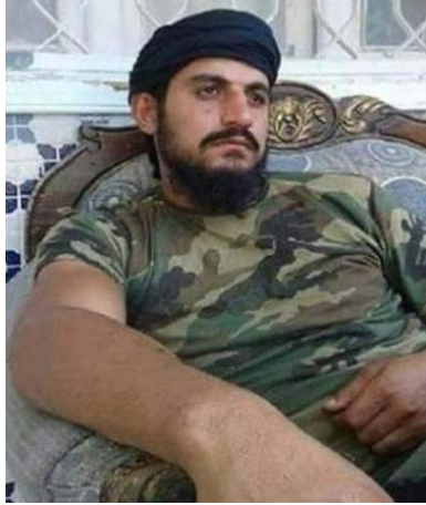
מצטפא אלמסאלמה, היעד לפיגוע ההתאבדות (ענב בלדי, אתר חדשות סורי המזוהה עם ארגוני המורדים, 22 ביולי 2020).