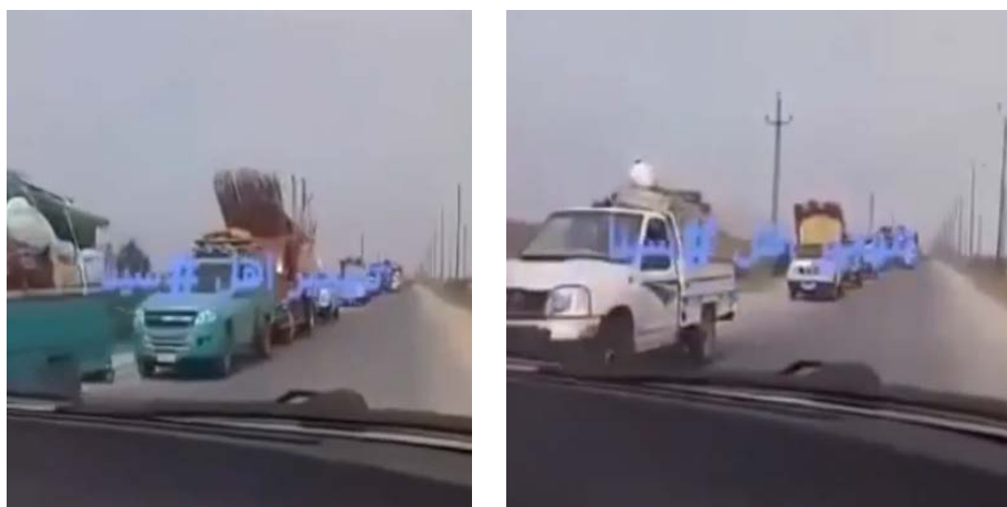
תושבי הכפרים שעליהם השתלטו פעילי דאעש נמלטים (יוטיוב, 27 ביולי 2020).

המצריים ניהלו חילופי אש עם "חמושים" הנמצאים בכפרים הללו. לעבר הכפרים נורתה אש מטוסים וטנקים (עמודי הפייסבוק של אנבאא' סינאא' ושאהד סינאא', 27 ביולי 2020). בתקריות הללו נהרג קצין מצרי בדרגת סגן אלוף (אלח'ליג' אלג'דיד, 27 ביולי 2020). מועצת העיר בא'ר אלעבד הודיעה כי היא מכינה מקומות לינה עבור פליטים מהכפרים בבתי ספר ובמוסדות ציבור (עמוד הפייסבוק שאהד סינאא', 24 ביולי 2020).