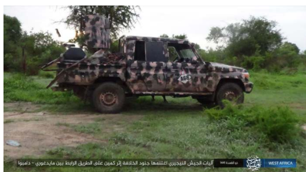
מימין: אחד מכלי הרכב של צבא ניגריה, שנתפסו בעת המארב (טלגרם, 8 ביולי 2020). משמאל: כלי רכב של צבא ניגריה עולה באש (טלגרם, 8 ביולי 2020).