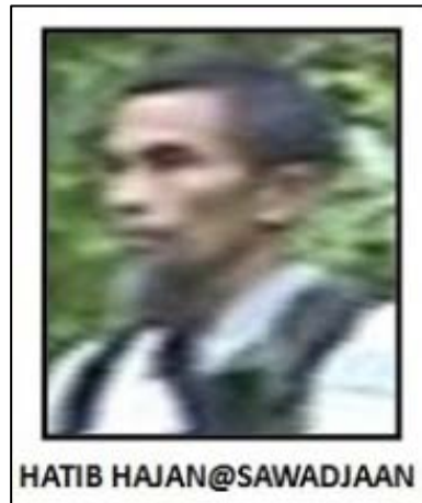
מנהיג ארגון אבו סיאף ח'טיב חג'אן סואדג'אן (borneotoday.net, 23 בנובמבר 2016).