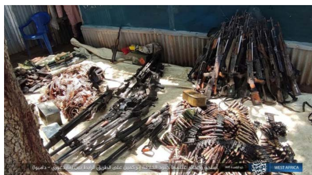
מימין: אמצעי לחימה ותחמושת של צבא ניגריה, שנתפסו בעת המארב (טלגרם, 8 ביולי 2020). משמאל: גופות של חיילי צבא ניגריה, שנהרגו במארב (טלגרם, 8 ביולי 2020).