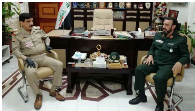
פגישת רמטכ"ל עיראק עם הנספח הצבאי האיראני בבגדאד (אירנ"א, 23 ביוני 2020).

◀ הנספח הצבאי האיראני בבגדאד, מצטפא מראדיאן (Mostafa Moradian), נפגש בשבוע שעבר עם הרמטכ"ל העיראקי החדש, עבד אלאמיר יאראללה (Abdul Amir Yarallah), ודן עמו בשיתוף הפעולה הצבאי בין שתי המדינות ובמערכה נגד דאעש. מראדיאן הביע את נכונות ארצו לסייע לכוחות המזוינים העיראקים בתחומים השונים. רמטכ"ל עיראק ביקש להרחיב ולחזק את שיתוף הפעולה המודיעיני במסגרת הוועדה המשותפת לאיראן, לרוסיה, לסוריה ולעיראק, שהוקמה לצורך חילופי מודיעין ותיאום המאבק בדאעש (אירנ"א, 23 ביוני 2020).