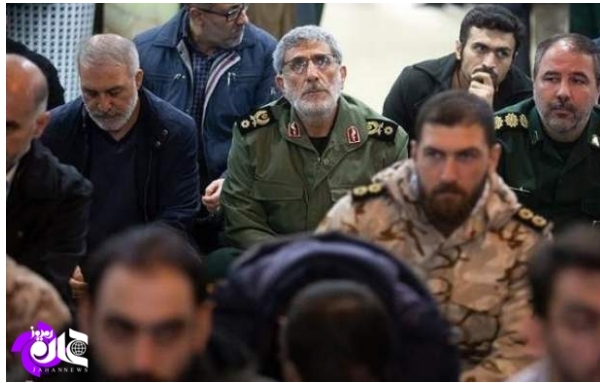
אסמאעיל קאא'ני, מפקד כוח קדס של משמרות המהפכה (במרכז התמונה) (ג'האן ניוז, 20 ביוני 2020).

◀ אתר חדשות איראני פרסם כתבה, שבה התייחס לשינוי במאפייני פעילות כוח קדס של משמרות המהפכה בעקבות חיסול קאסם סלימאני ומינויו של אסמאעיל קאא'ני למפקד הכוח. בכתבה נכתב, כי בשונה מקודמו, מעדיף קאא'ני פעילות חשאית על פני פעילות גלויה, אך ממשיך לקדם את יעדי העל האיראנים בזירות השונות. בעיראק מקדם קאא'ני פעילות מדינית חשאית למחצה במטרה להביא לקביעת מועד לנסיגת הכוחות האמריקאים מעיראק בנסיבות החדשות, שנוצרו בעקבות מינוי מצטפא כאט'מי כראש ממשלת עיראק; בתימן עומד קאא'ני מאחורי הישגיהם האחרונים של החות'ים במערכה נגד הכוחות הנתמכים על-ידי ערב הסעודית בשבועות האחרונים; בסוריה, שבה הגביר קאא'ני את נוכחותו בחודשים האחרונים, צפויות התפתחויות משמעותיות בזירת הלחימה, שישפיעו על רוסיה ועל תורכיה; ובלבנון, לא זו בלבד שהתוכנית לחיזוקו הצבאי של חזבאללה לא נפסקה אלא שהיא אף נכנסה לשלבים "מסוכנים ביותר עבור הציונים". בסיכום הכתבה נכתב, כי כוח קדס תחת פיקודו של קאא'ני נכנס לשלב חדש המתאפיין בפעילות חשאית יותר מאשר בעבר, מה שמשפר את יכולותיו אל מול אויבי איראן באזור (ג'האן ניוז, 20 ביוני 2020).