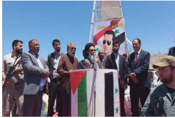
נציג מנהיג איראן בסוריה (פארס, 15 ביוני 2020).