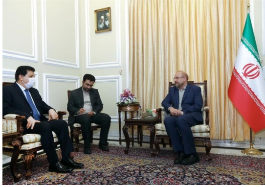
פגישת יו"ר המג'לס עם שגריר סוריה בטהראן (תסנים, 22 ביוני 2020).