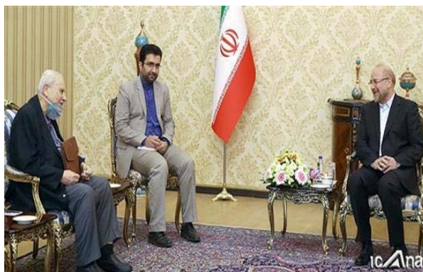
פגישת יו"ר המג'לס עם שגריר פלסטין בטהראן.

◀ יו"ר המג'לס, מחמד באקר קאליבאף, נפגש ב-24 ביוני 2020 עם שגריר פלסטין באיראן, צלאח אלזואוי (Salah al-Zawawi), והצהיר, כי שאלת פלסטין אינה רק שאלה פוליטית, כי אם אסלאמית וכי תמיכת איראן בפלסטין מהווה עקרונ יסוד במדיניות איראן. הוא ציין, כי "המשטר הציוני" ניצב בפני משבר פנימי ומתפורר מבפנים. השגריר הפלסטיני בטהראן אמר בפגישה, כי העלמות ישראל היא ודאית (תסנים, 24 ביוני 2020).