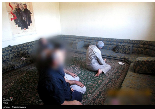
אסמאעיל קאא'ני במהלך ביקורו באלבוכמאל (תסנים, 27 ביוני 2020)

◀ שר החוץ האיראני, מחמד ג'ואד זריף, ביקר ב-15 ביוני 2020 בתורכיה ודן עם עמיתו התורכי, מבלוט צ'בושאולו, ביחסים בין שתי המדינות ובהתפתחויות האזוריות. במסיבת עיתונאים משותפת לשרי החוץ אמר זריף, כי בכוננת טהראן לארח בקרוב פגישה וירטואלית של נציגי תהליך אסטנה לקידום ההסדרה בסוריה (אירנ"א, 15 ביוני 2020). בתום ביקורו באנקרה, המשיך זריף לביקור במוסקבה.