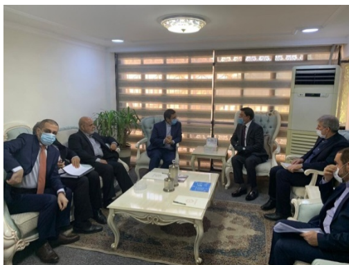
פגישת נגידי הבנקים המרכזיים של איראן ועיראק (אירנ"א, 17 ביוני 2020).

◀ במהלך ביקורו בבגדאד נפגש נגיד הבנק המרכזי האיראני גם עם שר האוצר העיראקי, עלי עלאוי, ועם ראש ממשלת עיראק, מצטפא כאט'מי, שהביע תקווה להסרת הסנקציות הכלכליות, שהוטלו על איראן. כאט'מי ציין, כי עיראק ניצבת לצד איראן ומוכנה לסייע לה לנוכח התנאים הקשים הניצבים בפניה, כשם שאיראן ניצבה לצד עיראק בעבר. בתום פגישתו של הנגיד האיראני עם שר האוצר העיראקי אמר המת, כי עיראק הביעה נכונות לשלם את חובותיה לאיראן עבור יצוא הגז והחשמל (אירנ"א, 17 ביוני 2020).