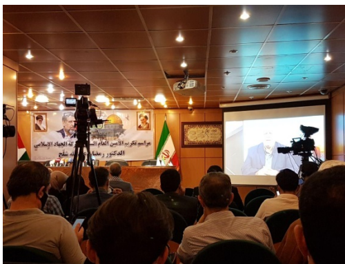
טקס לזכרו של רמצ'אן שלח בטהראן (אתר רשות השידור האיראנית, 20 ביוני 2020).

◀ ב-20 ביוני 2020 התקיים בטהראן טקס זיכרון למזכ"ל הג'האד האסלאמי בפלסטין לשעבר, רמצ'אן שלח, שמת בראשית יוני 2020. בהודעה מטעם מפקד כוח קדס של משמרות המהפכה, אסמאעיל קאא'ני, נאמר, כי הכוח ימשיך לעמוד לצד "ההתנגדות הפלסטינית". קאא'ני שיבח את שלח על המאבק, שניהל נגד "המשטר הציוני", והבטיח להמשיך בתמיכה בג'האד האסלאמי בפלסטין עד למימוש היעד הסופי של שחרור פלסטין וירושלים, כשם שעשה מפקד כוח קדס לשעבר, קאסם סלימאני, שחוסל בינואר 2020 (תסנים, 20 ביוני 2020).