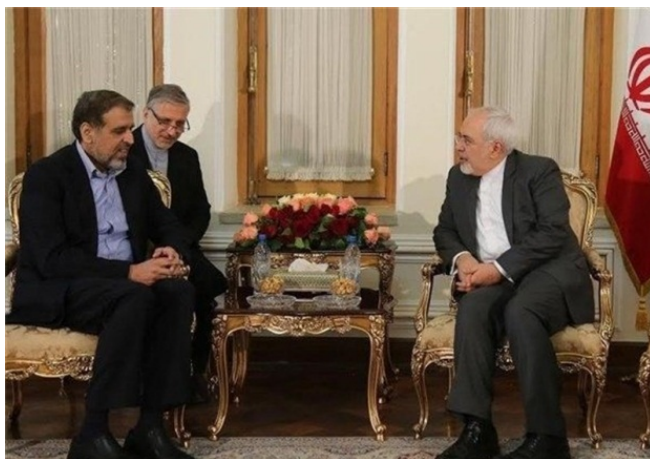
פגישת שר החוץ האיראני זרף עם רמדאן שלח בטהראן במאי 2016 (תסנים, 7 ביוני 2020)

◀ מזכיר המועצה העליונה לביטחון לאומי, עלי שמח'אני, כתב באיגרת תנחומים למזכ"ל הג'האד האסלאמי בפלסטין, זיאד אלנח'אלה, כי מאבקו של שלח הוא נכס יקר עבור עמיתיו, שיצעדו בדרכו עד לשחרורה המלא של ירושלים ולחיסולו המוחלט של "המשטר הציוני" (מהר, 7 ביוני 2020). מפקד כוח קדס של משמרות המהפכה, אסמאעיל קאא'ני, שיבח במכתב תנחומים לזיאד אלנח'אלה את המאבק, שניהל שלח "נגד המשטר הציוני", וקרא ללוחמי הג'האד האסלאמי בפלסטין להמשיך בדרכו עד לשחרור פלסטין וירושלים. הוא ציין, כי איראן תמשיך לעמוד לצד הפלסטינים ולחזק את "ציר ההתנגדות", כשם שעשה קאסם סלימאני (איסנ"א, 7 ביוני 2020).