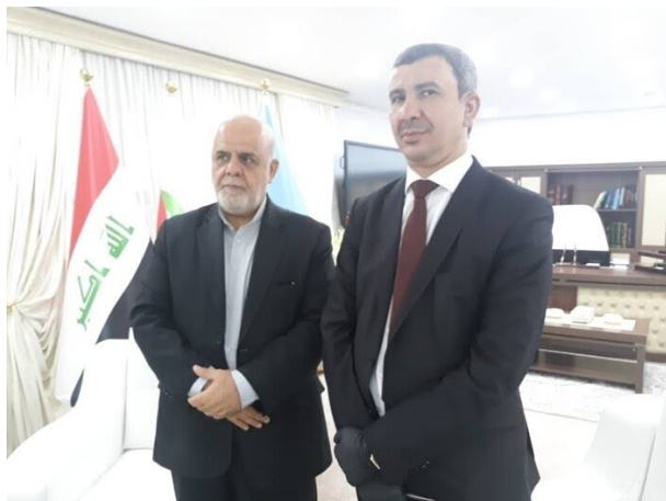
פגישת שגריר איראן בבגדאד עם שר הנפט העיראקי (אירן"א, 10 ביוני 2020)

ממשלתו החדשה של מצטפא אלכאט'מי בחודש שעבר, נפגש מסג'די עם ראש הממשלה ועם שרי הפנים, ההגנה, התחבורה, העבודה והעניינים החברתיים, הפיתוח, האוצר, ההשכלה הגבוהה והנפט.