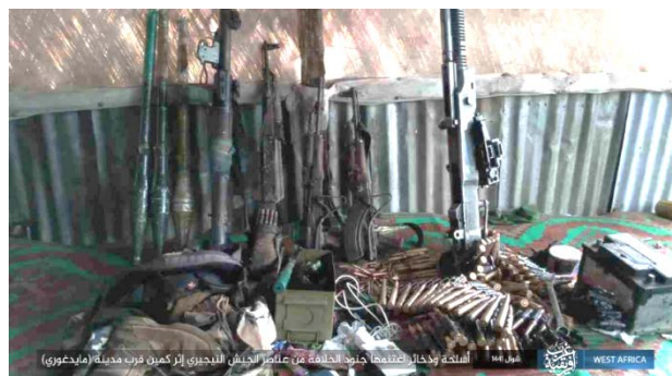
Droite : Armes et munitions de l'armée nigériane, capturées par l'Etat islamique. Gauche : Des véhicules de l'armée nigériane saisis par des membres de l'Etat islamique (Ezdarath, 20 juin 2020)

► Le 17 juin 2020 : Des membres de l'Etat islamique en Afrique de l'Ouest ont lancé une attaque contre des véhicules de l'armée nigériane près du Tchad. Huit soldats ont été tués (Ezdarath, 17 juin 2020).