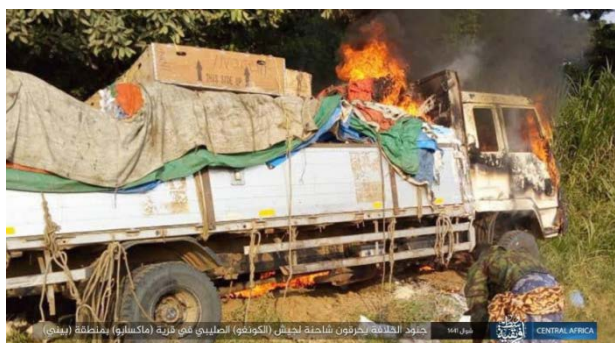
Camion utilisé par l'armée congolaise en flammes après avoir été pris pour cible par des tirs de mitrailleuses de l'Etat islamique (Isdarat, 21 juin 2020)