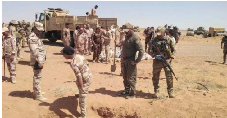
Une force conjointe de la mobilisation populaire et de l'armée irakienne lors d'activités de sécurité contre l'Etat islamique (al-hashed.net, 21 juin 2020)

► Le 21 juin 2020 , une force conjointe de mobilisation populaire et de l'armée irakienne a détruit un dépôt d'équipement et trois maisons d'hôtes de l'Etat islamique (al-hashed.net, 21 juin 2020).