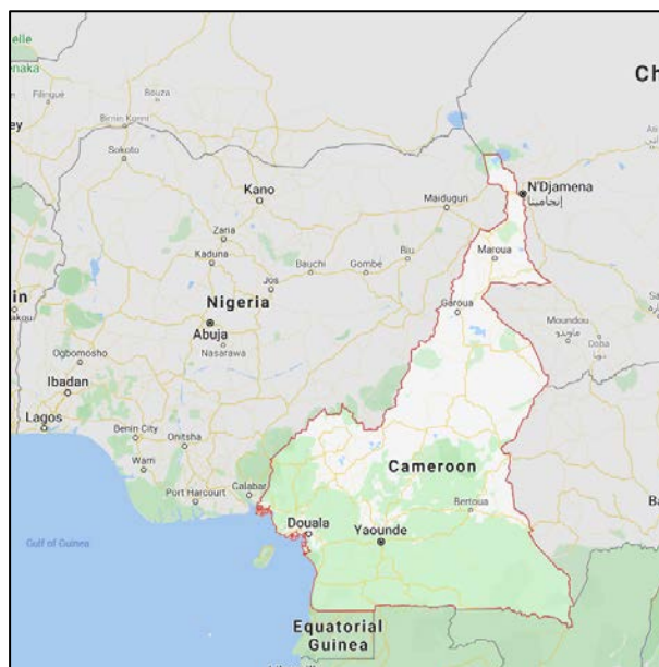
Carte du Cameroun. Le lac Tchad est situé dans le Nord du pays, près de la frontière entre le Nigéria et le Tchad