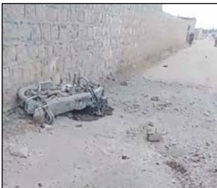
La moto sur laquelle roulaient les deux commandants supérieurs de l'Etat islamique (Khotwa, 20 juin 2020)

►Le 20 juin 2020, à midi, un drone de la Coalition internationale a attaqué une moto transportant deux commandants de l'Etat islamique à l'entrée de la ville d'Al-Bab, à environ 30 km au Nord-Est d'Alep. Ils ont été tués (Enab Baladi, un site d'information syrien affilié aux organisations rebelles, 20 juin 2020). Le plus âgé des deux était Fayez al-'Akkal, alias Abu Saad al-Shimali, qui avait une carte d'identité turque. Il a été gouverneur de l'Etat islamique à Al-Raqqah pendant plusieurs mois. L'autre membre qui a été tué (selon une autre version, il a été blessé) était également un haut responsable de l'Etat islamique (Khotwa, 20 juin 2020).