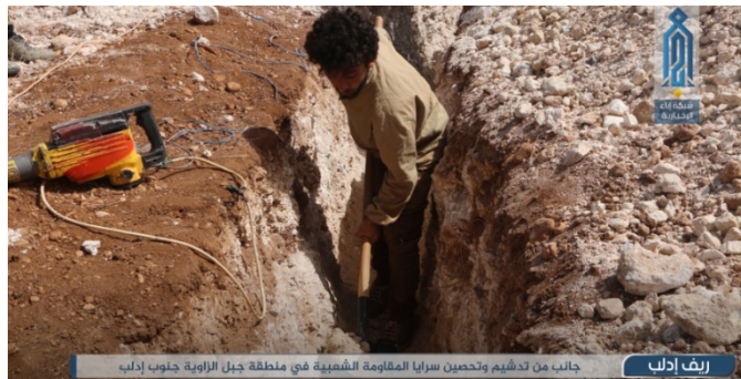
Membres du Siège de Libération d'Al-Sham pendant les travaux de fortification (Ibaa, 19 juin 2020)