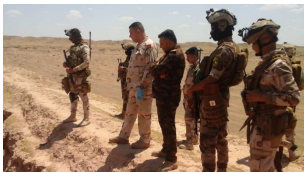
Forces de sécurité irakiennes localisant les engins piégés de l'Etat islamique (Ministère irakien de la Défense, 21 juin 2020)