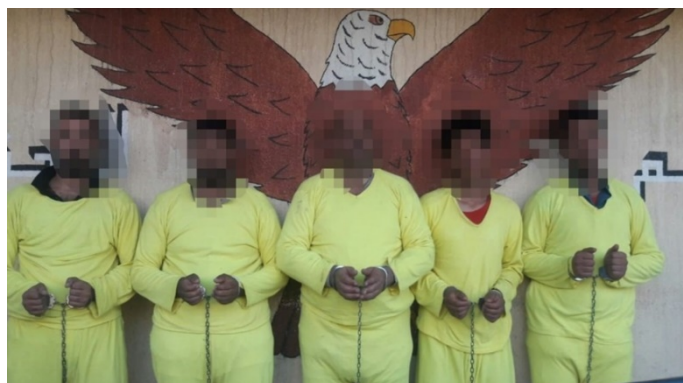
Cinq membres de l'Etat islamique capturés par la force de la Direction du renseignement (Al-Sumaria, 20 juin 2020)

► Le 20 juin 2020 , une force de la Direction du renseignement a capturé cinq membres de l'Etat islamique opérant dans la province d'Al-Anbar. Interrogés, ils ont reconnu avoir enlevé et tué plusieurs habitants du désert d'Al-Anbar. Par la suite, les corps des résidents ont été retrouvés dans la zone désertique d'Al-Rutba (Al-Sumaria, 20 juin 2020).