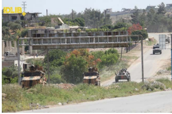
مدرعات الجيش التركي والشرطة العسكرية الروسية أثناء دوريتهم المشتركة العاشرة (صفحة فيسبوك Edlib Plus، 12 أيار/ مايو 2020).

◀ بعد قيام الجيش التركي بفرض تسيير الدوريات المشتركة بالقوة (26 نيسان/ أبريل 2020)، بدأ تسيير الدوريات بشكل منتظم في 7 أيار/ مايو 2020 وقامت تركيا وروسيا بتسيير الدوريات المشتركة التاسعة على شارع M-4 (انطوليا، 7 أيار/ مايو 2020). وصلت الدوريات إلى أطراف مدينة اربحا، على مبعده ما يقارب 12 كلم إلى الجنوب من إدلب. وفي 12 أيار/ مايو 2020 تم تسيير الدوريات المشتركة العاشرة (صفحة فيسبوك Edlib Plus، 8 أيار/ مايو 2020). أعلنت هيئة تحرير الشام عن معارضتها للدوريات المشتركة وتأييدها لاعتصام السكان (إبء، 8 أيار/ مايو 2020). أما من الناحية العملية فقد تجمع المتظاهرون في منطقة اربحا أثناء تسيير الدوريات العاشرة لكنهم لم يعترضوا طريقها (صفحة فيسبوك Edlib Plus، 12 أيار/ مايو 2020).