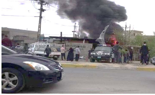
تفجير العبوة الناسفة في منطقة المعالف في جنوب بغداد (10 أيار/ مايو 2020). (lgamesh.com)

وهذه العملية المركبة في بغداد تأتي بتقديرنا لإيقاع أكبر عدد من القتلى في صفوف السكان الشيعة ولضعضة الأمن في المدينة ولتذكير الحكومة العراقية والجمهور العراقي بجرأة تنظيم الدولة الإسلامية المتزايدة وبقدراته العملياتية المتقدمة. وحتى إن لم يتم تحقيق جميع تلك الأهداف فإن العملية تدل على أنه بالتوازي مع عمليات حرب العصابات "الاعتيادية" فإن تنظيم الدولة الإسلامية يسعى لتنفيذ عمليات "نوعية" ذات صدى سياسي وفكري على الساحة العراقية.