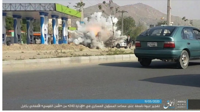
تفجير العبوة الناسفة لاستهداف قائد كبير في الأمن الوطني الأفغاني (تلغرام، 11 أيار/ مايو 2020).

◀ 6 أيار/ مايو 2020: فجر عناصر تنظيم الدولة الإسلامية عبوة ناسفة استهدفت دراجة نارية يركبها مقاتلان ن حركة طالبان إلى الجنوب الغربي من جلال باد، حيث أسفر التفجير عن إصابتها بجروح (تلغرام، 7 أيار/ مايو 2020).