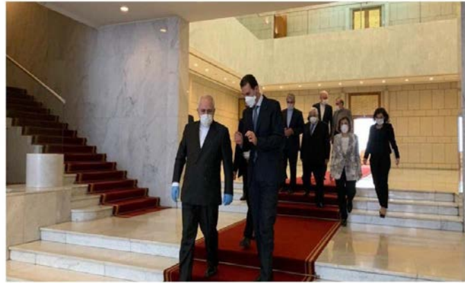
שר החוץ האיראני לצד נשיא סוריה (תסנים, 20 באפריל 2020).

קאסם סלימאני לא יביא לשינוי כלשהו בתמיכת איראן ב"התנגדות" ובמאבק בטרור באזור. הנשיא אסד הביע תנחומים על מותם של קורבנות מגפת הקורונה באיראן ושיבח את סלימאני והתפקיד, שמילא ב"מאבק נגד הטרור בסוריה" (פארס; תסנים, 20 באפריל).