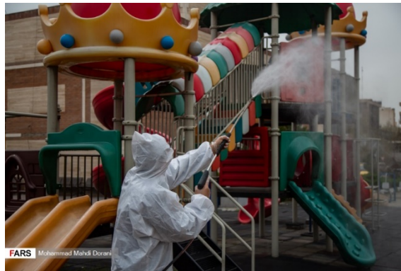
פעילות חיטוי נגד נגיף הקורונה בטהראן (פארס, 22 במרץ 2020).

למצוקה הכלכלית מתווספות גם השלכות הריגתו של מפקד כוח קדס של משמרות המהפכה, קאסם סלימאני, בראשית ינואר 2020, שהנחיתה מכה קשה על יכולתה של איראן לקדם את יעדיה האסטרטגיים במזרח התיכון, לכל הפחות בטווח הקצר. התפשטות הנגיף מאיראן למדינות נוספות באזור עשויה גם להעצים את הביקורת באזור נגד איראן, המואשמת במידה רבה באחריות להתפרצות הנגיף, לאחר שהתעכבה מאוד בנקיטת הצעדים הדרושים, שעשויים היו לבלום את התפשטות המגפה.