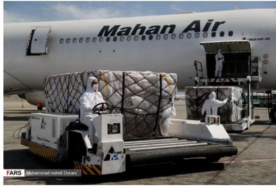
העברת ציוד רפואי על-ידי חברת התעופה "מאהאן אייר" ( פארס, 20 במרץ 2020 ).

◀ התפרצות הקורונה אינה רק מציבה קשיים נוספים בפני פעילות איראן בסוריה, אלא עלולה אף לסכן את חייהם של לוחמי משמרות המהפכה, חזבאללה והמיליציות השיעיות הפרו-איראניות הפועלות בסוריה, הגם שרק ב-22 במרץ אישרו שלטונות סוריה מקרה ראשון של הידבקות בנגיף במדינה. שני רופאים בבית החולים תשרין בדמשק דיווחו לאחרונה, כי כמה לוחמים זרים במיליציות השיעיות טופלו במתקן רפואי מאובטח לאחר שפיתחו תסמינים של קורונה. עדויות אלה מצטרפות לדיווחים של מקורות אופוזיציה סורים על התפשטות הנגיף בקרב לוחמי המיליציות השיעיות בסוריה (Syria in Context, 17 במרץ 2020).