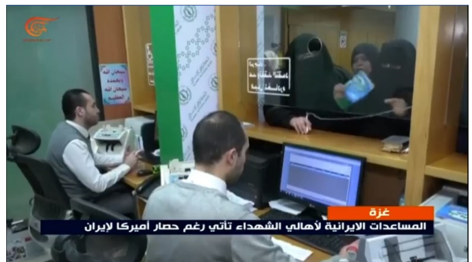
מימין: חלוקת הכספים לנציגי משפחות השהידים בבנק הלאומי האסלאמי עם הצגת התלושים. משמאל: ספירת שטרות הדולרים, שמחולקים למוטבים בבנק הלאומי האסלאמי (דף הפייסבוק של אגודת אלנצאר, 27 בינואר 2020)

◀ בניגוד לשנים קודמות לא צוין השנה הסכום הכולל, שהועבר לטובת המשפחות. אולם, בהנחה שכל משפחה מקבלת סכום הנע בין 300-600 דולרים והמדובר בכ-4,800 זכאים בהערכה גסה עומד סכום הסיוע לשנה הנוכחית על כשני מיליון דולרים. יוזכר כי סכומים דומים הועברו לאגודת אלנצאר בשנת 2018 (1,870,000 דולרים) ובשנת 2017 (כשני מיליון דולרים). 2