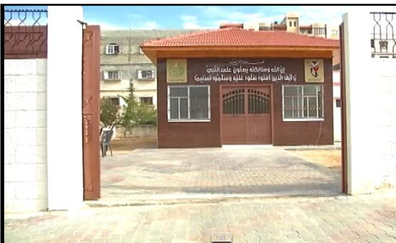
משכנה החדש של אגודת אלנצאר (יוטיוב, 26 בינואר 2020).