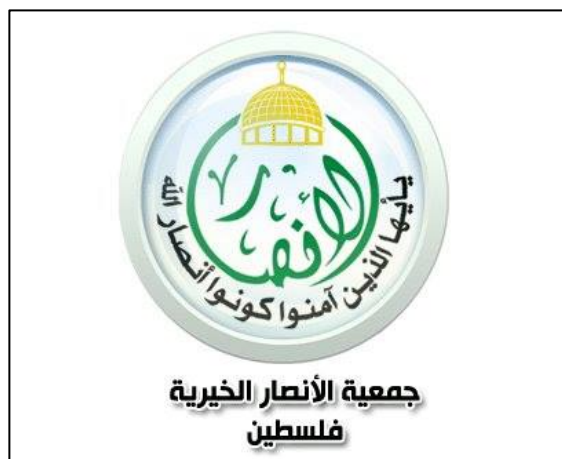
הלוגו של אגודת הצדקה אל-אנצאר

◆ הבנק הלאומי האסלאמי: הבנק הוקם ברצועת עזה על ידי ממשל חמאס בנובמבר 2008. לבנק ארבעה סניפים ברצועה. הרשות הפלסטינית אינה מכירה בו והיא אף הוציאה אותו מחוץ לחוק. משרד האוצר האמריקאי הכריז עליו (2010) כעל ארגון טרור משום שהוא נשלט על ידי חמאס ומספק לה שירותים כספיים, כולל לפעילי הזרוע הצבאית. במהלך מבצע "צוק איתן" הותקפו סניפי הבנק במערב עזה ובח'אן יונס על ידי חיל האוויר הישראלי בשל היותו מוסד של חמאס המעביר כספים לפעילות טרור. שנתיים קודם לכן, במהלך מבצע "עמוד ענן", הותקף סניף הבנק בעיר עזה.