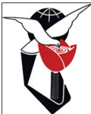
לוגו מוסד השהיד של חזבאללה בלבנון

◆ מוסד השהיד של חזבאללה, הפועל בלבנון: שלוחה של קרן השהיד האיראנית, שהוקמה במטרה לטפל במשפחות השהידים של חזבאללה. המדובר במוסד של חזבאללה המעניק מעטפת חברתית וכלכלית תומכת למשפחות פעילי הזרוע הצבאית של הארגון. בתחום התודעתי עוסק מוסד השהיד בטיפוח "תרבות השהידים" (קרי, האדרת השהידים של חזבאללה והפיכתם למודל לחיקוי לדור הצעיר). בשל היקף פעילותו הנרחב ההוצאות השנתיות של המוסד של חזבאללה גדולות ביותר ועל פי הערכה גסה הן מסתכמות בסביבות מאה מיליון דולרים (מרביתם מועברים מאיראן) 1 .