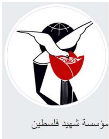
לוגו מוסד שהיד פלסטין

מימין: כרזה בעת חלוקת הסיוע בפברואר 2019: אגודת הצדקה אלאנצאר, בסיוע מוסד שהיד פלסטין, מבצעת את פרויקט התמיכה והטיפול במשפחות השהידים (ערוץ אלוטניה, 21 בפברואר 2019) משמאל: משלחת מטעם הג'האד האסלאמי בפלסטין מבקרת במשרדי אגודת הצדקה אלאנצאר בעזה. את המשלחת מקבל יו"ר האגודה נאפד' אלערג' (דף הפייסבוק של אגודת אלאנצאר בעזה, 17 במרץ 2015)