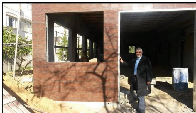
נאפד', אלנצרג' יו"ר האגודה, באתר בו נבנה משכנה החדש של האגודה במהלך עבודות הבנייה (יוטיוב, 26 ינואר 2015)