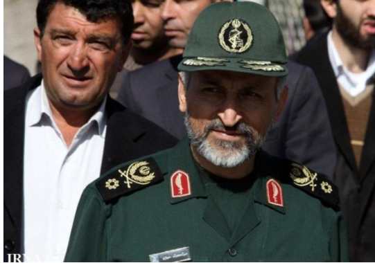
מחמד חסיין-זאדה חג'אזי, סגן מפקד כוח קדס הנכנס (אירן"א, 20 בינואר 2020)

◀ באוגוסט 2019 חשף צה"ל, כי חג'אזי משמש כמפקד גיס לבנון בכוח קדס של משמרות המהפכה. שמו נחשף לצד שמותיהם של שני קצינים איראנים נוספים, כמי שנטל חלק בהובלת פרויקט דיוק הטילים של חזבאללה.