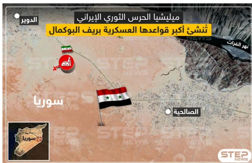
בסיס משמרות המהפכה באזור אלבוכמאל (Step News, 20 בינואר 2020)

אתר חדשות המזוהה עם האופוזיציה הסורית דיווח, כי משמרות המהפכה הקימו בסיס צבאי חדש באזור אלבוכמאל סמוך לגבול עיראק-סוריה. על-פי הדיווח, העבירו משמרות המהפכה עד כה 120 לוחמים ממיליציות פרו-איראניות הפועלות בעיראק דרך מעבר הגבול אלבוכמאל לבסיס החדש הממוקם על ההר המשקיף על העיירה אלצאלחיה ומכיל בונקרים ומנהרות תת-קרקעיות. כמו כן החלו משמרות המהפכה להקים בבסיס עמדות תצפית וצלפים (Step News, 20 בינואר 2020).