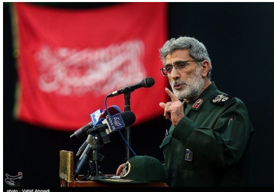
מפקד כוח קדס הנכנס, אסמאעיל קא'אני (תסנים, 20 בינואר 2020)

◀ ב-20 בינואר 2020 מונה אסמאעיל קא'אני באופן רשמי למפקד כוח קדס של משמרות המהפכה. בטקס שנערך בטהראן הצהיר קא'אני, כי על איראן להתייצב מול אויביה המבינים אך ורק את שפת הכוח. הוא ציין, כי האמריקאים לא העזו להתייצב מול סלימאני בשדה הקרב והרגו אותו באופן פחדני, אך הנקמה על מותו תהיה צודקת ו"גברית" (תסנים, 20 בינואר 2020).