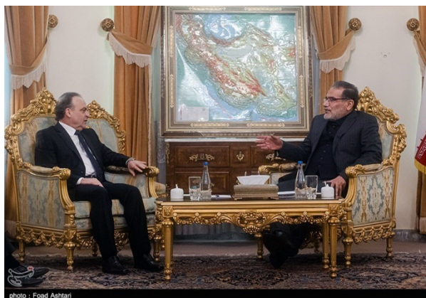
פגישת ראש ממשלת סוריה עם מזכיר המועצה העליונה לביטחון לאומי האיראני

◀ בפגישה עם ראש ממשלת סוריה אמר מזכיר המועצה העליונה לביטחון לאומי, עלי שמח'אני, כי הוצאת ארצות-הברית מהאזור צריכה לעמוד בראש סדר העדיפויות כדי לשים קץ לחוסר הביטחון והיציבות. הוא ציין, כי טראמפ ויועציו העריכו, כי חיסול קאסם סלימאני יביא להתפרקות "חזית ההתנגדות" באזור, אך לחיסולו תהיה השפעה הפוכה והוא יחזק את החזית ויעצים את השנאה בקרב רוב עמי האזור והעולם כלפי ארצות-הברית. הוא הוסיף, כי מותו של סלימאני יגביר גם את נחישות "חזית ההתנגדות" להיבק כנגד התוקפנות הנמשכת מצד "המשטר הציוני". ראש ממשלת סוריה הביע תנחומים על מותו של סלימאני והערכה לתמיכת איראן בסוריה במערכה "נגד הטרור".