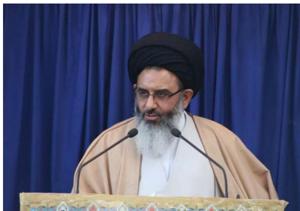
נציג מנהיג איראן בסוריה (תסנים, 18 בינואר 2020)

לחיסול קאסם סלימאני. הוא ציין, כי האמריקאים לא יכלו לשאת את חיסול דאעש על-ידי סלימאני וחששו, כי בשלב הבא יחסל סלימאני גם את "המשטר הציוני", ולפיכך החליטו להתנקש בחייו. נציג המנהיג בסוריה הצהיר, כי חיסול סלימאני ייצור אווירה חדשה באזור, שתביא בסופו של דבר ליציאת האמריקאים מהאזור. דמם של החללים, שחוסלו על-ידי האמריקאים, יהיה תחילת חיסולה של "אימפריית הרשע האמריקאית" באזור ובעולם כולו. הוא הזהיר, כי אף מקום לא יהיה בטוח עבור האמריקאים באזור וכי עליהם להימלט ממנו בטרם יתרחשו להם אירועים נוספים (תסנים, 18 בינואר 2020).