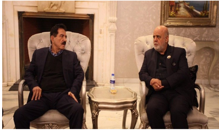
פגישת שגריר איראן בעיראק עם בכיר בחבל הכורדי בצפון עיראק (פארס, 14 בינואר 2020)