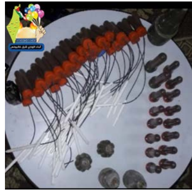
יחידת בני אלזוארי במזרח ח'אן יונס מציגה נפצים/מרעומים

◀ להלן כמה דוגמאות לאיתורי בלוני התבערה והנפץ: