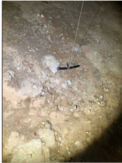
הצינור אליו חוברו הבלונים (חשבון הטוויטר של Baron28, 15 בינואר 2020)