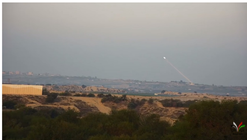
תיעוד בזמן אמת של אחד משיגורי הרקטות לעבר עוטף עזה (ערוץ GAZA NOW ביוטיוב, 15 בינואר 2020)

◀ ב-15 בינואר 2020 בשעות אחר הצהריים שוגרו ארבע רקטות מרצועת עזה לשטח ישראל . שתי רקטות יורטו על ידי מערכת כיפת ברזל. השתיים הנותרות נפלו בשטח פתוח. לא היו נפגעים ולא נגרם נזק.