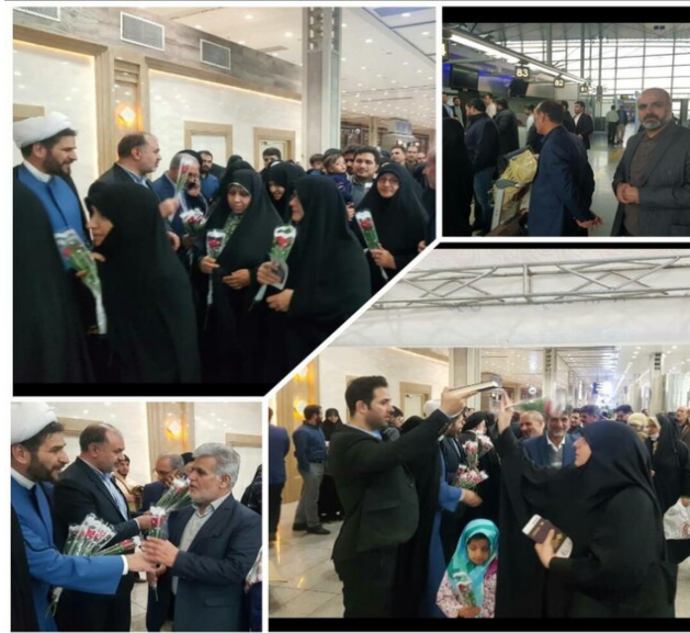
משלחת ראשונה של עולי רגל איראנים לסוריה לאחר הפסקה של שמונה שנים (איסנ"א, 16 בדצמבר 2019).