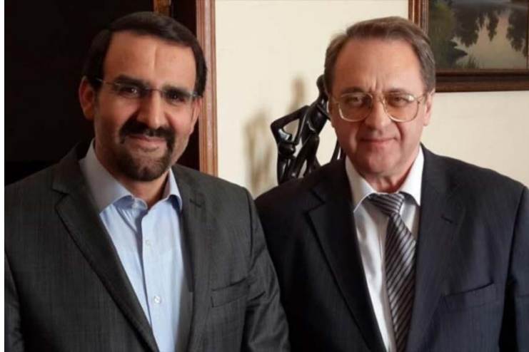
פגישת שגריר איראן היוצא ברוסיה עם סגן שר החוץ הרוסי (אירן"א, 18 בדצמבר 2019).