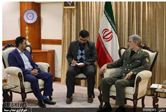
פגישת "שגריר החות'ים" בטהראן עם שר ההגנה האיראני (23 בדצמבר 2019).

◀ ערוץ הטלוויזיה אלמסירה השייך למורדים החות'ים בתימן דיווח (23 בדצמבר 2019) על חתימת הסכם רשמי ראשון לשיתוף פעולה צבאי בין החות'ים לאיראן. על-פי הדיווח, נחתם ההסכם בפגישה, שהתקיימה בין שגריר תנועת אנצ'אללה התימנית בטהראן, אבראהים מחמד אלדילמי (Ibrahim Mohammed al-Dailami), לשר ההגנה האיראני, אמיר חתמי (Amir Hatami). בפגישה הדגיש חתמי את תמיכת ארצו בפתרון פוליטי למשבר בתימן והתייחס לשיפור ביכולותיהם הצבאיות של החות'ים בתימן. מקור במשרד ההגנה האיראני הכחיש, כי נחתם הסכם לשיתוף פעולה צבאי בין שר ההגנה לנציג החות'ים (עצ-י איראן, 24 בדצמבר 2019).