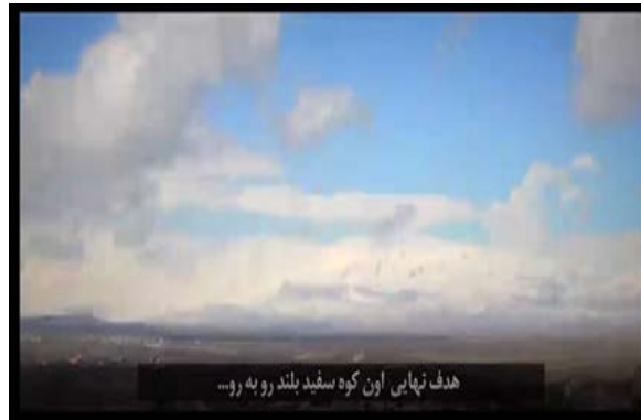
"המטרה הסופית היא ההר הלבן הגבוה הזה" (רמת הגולן) ◀ (ערוץ הטלגרם של חטיבת פאטמיון, 23 בדצמבר 2019).

◀ בתוך כך, אמר עלי-אכבר ולאיתי (Ali-Akbar Velayati), יועצו לעניינים בינלאומיים של מנהיג איראן, בריאיון לערוץ הטלוויזיה הרוסי RT (23 בדצמבר 2019), כי במוקדם או במאוחר תזכה ישראל לתגובה על תקיפותיה ו"פשעה" בסוריה. הוא ציין, כי התקיפות הבלתי-חוקיות של ישראל באזור אינן יכולות להישאר ללא מענה וכי "ההתנגדות" בסוריה ובלבנון תיאבק נגד פשעי ארה"ב וישראל. ולאיתי הזהיר, כי אם ישראל תתקוף את לבנון, חזבאללה יכה אותה "עד עפר". בהתייחסו להתפתחויות בלבנון, האשים ולאיתי את סעודיה וישראל במעורבות בהפגנות במדינה והביע את תמיכת איראן בחסאן דיאב, שקיבל את המנדט להקמת ממשלה חדשה בלבנון. ◀ חטיבת פאטמיון האפגאנית הפועלת בחסות משמרות המהפכה בסוריה פרסמה סרטון ברשתות החברתיות, שבו מאיימים לוחמי המיליציה השיעית הפרו-איראנית להגיע עד רמת הגולן. בסרטון אומר לוחם במיליציה, כי הרי רמת הגולן הם המטרה הסופית של לוחמי החטיבה, כי הם קרובים לישראל וכי לחימת המיליציה בחלב ובתדמור הייתה רק הכנה לקראת העימות הסופי עם "הציונים הפחדנים".