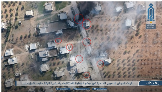
כלי רכב של צבא סוריה (מסומנים בעיגולים אדומים במקור), שהושמדו מפיצוץ מכונית התופת (אבאא', 21 בדצמבר 2019).