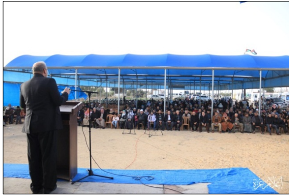
השתתפות דלה יחסית וכסאות מיותרים במחנה השיבה במזרח העיר עזה בצעדה ב-13 בדצמבר

הניכרת בקרב הציבור העזתי מקיום הצעדות , בעיקר בשל המחירים שהציבור ברצועה נאלץ לשלם (הרוגים ופצועים, שיבוש חיי האוכלוסייה בסבבי ההסלמה הנשנים וחוזרים), ביטוי מובהק לעייפות ניתן למצוא בירידה עקבית במספר המשתתפים בצעדות (בימי השיא עשרות אלפים, אח"כ 10,000-15,000, אח"כ 6,000-7,000 ובשבועיים האחרונים כ-2,500). אנו סבורים כי חמאס ושאר הארגונים נאלצים להתחשב בכך והדבר מצא ביטוי לאחרונה בשלושה שבועות רצופים שבהם לא התקיימו הצעדות (תופעה חסרת תקדים מאז תחילת הצעדות) 3 .