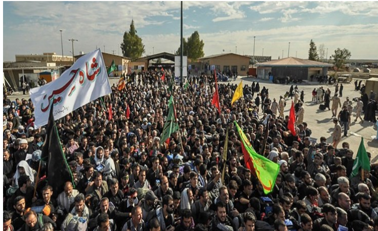
עולי רגל איראנים בעיראק במסגרת טקסי אלארבעין (פארס, 12 באוקטובר 2019).

◀ בתוך כך, גובר החשש באיראן מפני השפעת המשך המהומות בעיראק על הסחר בין שתי המדינות, בין היתר בשל קריאות מצד אזרחים עיראקים להחרמת מוצרים איראנים. חבר לשכת המסחר האיראנית, עלי שריעתי (Ali Shariati), פרסם ציוץ בחשבון הטוויטר שלו (8 בדצמבר 2019) בו תיאר את חוויותיו בטיסתו האחרונה מאיראן לעיראק בשבוע שעבר. הוא ציין, כי היה האיראני היחיד כמעט במטוס וכי כאשר נחת בשדה התעופה בבגדאד, חש בעוינות מצד הסובבים אותו, שהבחינו בדרכון האיראני שלו. לדבריו, שותפו הציע לו שלא ידבר בפרסית.