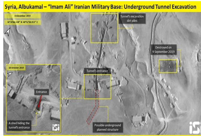
(10 בדצמבר 2019, ImageSat)

עיראק, שנפגע לפני כחודשיים בתקיפה שיוחסה לישראל. הבסיס הצבאי מיועד לאחסון תחמושת וכוחות של המיליציות הפרו-איראניות הפועלות במרחב זה. במקביל חשף בשבוע שעבר דו"ח של חברת ImageSat, כי איראן בונה מנהרה לאחסון טילים ורקטות בבסיס אמאם עלי. אורכה של המנהרה כ-120 מטרים, רוחבה כ-4.5 מטרים ועומקה כ-4 מטרים. לפי מידע זה, הוצבו בחלקו הצפון-מערבי של הבסיס עשרה מחסנים וכן מבנים לאחסון טילים.