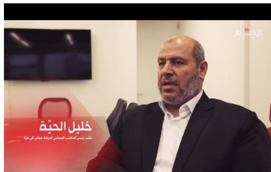
בכיר חמאס, ח'ליל אלחיה מתראיין לאלאח'באר הלבנוני (ערוץ ה-YOUTUBE של העיתון אלאח'באר, 5 בדצמבר 2019)

◆ "הדיבורים על הרגעה למשך 10 שנים או הפסקת פעולות ההתנגדות נגד האויב כלל אינם נכונים" . חמאס הינה "תנועת התנגדות". צורות ה"התנגדות" (קרי, פעילות הטרור) עשויות להשתנות מעת לעת, אולם חמאס "לא תפסיק להתנגד לאויב" . מטרת אסמאעיל הניה הנמצא במצרים, הינה להגיע להסכמה "על הרגעה שלא תכבול את ידי ההתנגדות" , ולבטח לא תמנע ממנה מלהגיב על תוקפנות כלשהי". לדבריו, "לא נדון בשום שולחן של מתווך בינינו לבין הכיבוש על הנושא של הבנה ארוכת טווח..." (ראיון לעיתון אלאח'באר הלבנוני, המזוהה עם חזבאללה, 5 בדצמבר 2019).