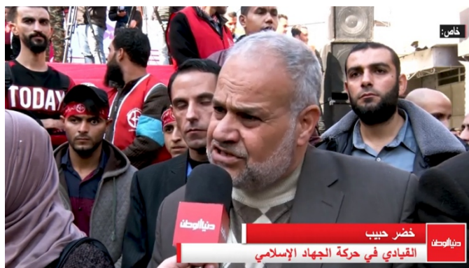
בכיר בג'האד האסלאמי, ח'צ'ר חביב, מתראיין בעזה (ערוץ דניא אלוטן, 7 בדצמבר 2019)

◀ ח'צ'ר חביב , בכיר בג'האד האסלאמי בפלסטין, דחה את הדיווחים על הסכמה עקרונית להרגעה ארוכת טווח עם ישראל תמורת הקלות כלכליות לרצועה, ואמר כי מדובר בהמולה תקשורתית ותו לא (סוכנות וטניה, 9 בדצמבר 2019). בראיון רחוב שקיים בעזה עם ערוץ דניא אלוטן, הוא אמר כי כל הדיבורים על הקמת נמל ושדה תעופה במסגרת הרגעה אינם נכונים, והם כלל לא נידונו במצרים. המדובר לדבריו ב"תקשורת צהובה" (ערוץ דניא אלוטן, 7 בדצמבר 2019).