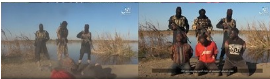
צילומים מתוך הסרטון המתעדים את הוצאה להורג (טלגרם, 8 בדצמבר 2019).

◆ 8 בדצמבר 2019: סוכנות אעמאק של דאעש פרסמה סרטון, אשר תעד הוצאה להורג של שלושה שוטרים ניגרים באזור בורנו, בצפון-מזרח המדינה (טלגרם, 8 בדצמבר 2019).