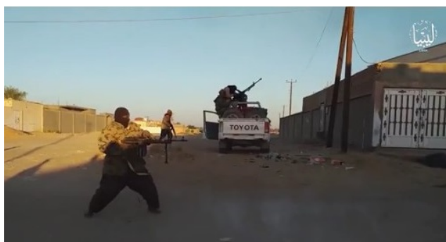
מימין: ירי, ככל הנראה לעבר כוחות הביטחון המקומיים בעיירה ע'דוה (אח'באר אלמסלמין, 4 בדצמבר 2019). משמאל: פעילי דאעש עוזבים את העיירה ע'דוה כשהם רכובים על רכבי שטח לתוככי המדבר (אח'באר אלמסלמין, 4 בדצמבר 2019).

מחוז לוב של דאעש ספג מכה קשה עם נפילת מרחב סרת בדצמבר 2016 . אולם דאעש לא נעקר מהשטח ופעילותו הועתקה למרכז לוב ולדרומה . בשנה האחרונה התפרסמו דיווחים לפיהם ישנן ניסיונות של מחוז לוב להתארגן מחדש, על רקע המצב הביטחוני המעורער במדינה, במיוחד באזור הדרום. ההערכה כי פעילותו של מחוז לוב מתרכזת באזור סבהא ובאזורים הרריים במרכז לוב . על-פי אומדן משנת 2018 מספר פעילי שלוחת דאעש בלוב הינו 3,000-4,000 (undocs.org, 4 במאי 2019; אלשרק אלאוסט, 17 באוקטובר 2019; וושינגטון פוסט, 24 בנובמבר 2019).