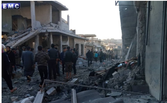
מבנים שנפגעו כתוצאה מתקיפות אוויריות מדרום לאדלב (Edlib Media Center – EMC, 7 בדצמבר 2019).

◆ 7 בדצמבר 2019: מטוסי קרב רוסיים ביצעו תקיפה אווירית באזור העיירה אלשיח' בחר, 22 ק"מ מצפון מערב לאדלב (Edlib Media Center – EMC, 7 בדצמבר 2019).