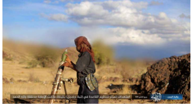
ירי פצצות מרגמה טרם לעבר ריכוז כוחות של פעילי אלקאעדה באזור קיפה (טלגרם, 9 בדצמבר 2019).