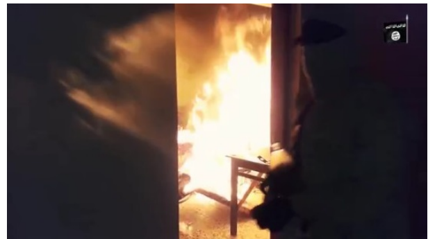
מימין: העלאת מרכז משמר העיירה באלפקהא' באש על-ידי פעילי דאעש (אח'באר אלמסלמין, 4 בדצמבר 2019). משמאל: הוצאה להורג של אנשי ביטחון שהגיעו למקום בידי פעיל דאעש (אח'באר אלמסלמין, 4 בדצמבר 2019).