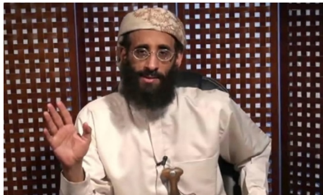
אנור אלעולקי (מתוך סרטון ביוטיוב, 30 בספטמבר 2011).

◆ אנאר אלעולקי: פעיל ג'האדיסטי יליד ארה"ב, ממוצא תימני. הוא נסע לאפגניסטאן והשתתף שם במחנות האימונים של אלקאעדה. מאוחר יותר עבר לתימן והיה מבכירי ארגון אלקאעדה בחצי האי ערב. אלעולקי גייס פעילים ממדינות המערב ואימן אותם במחנות בתימן. את האידאולוגיה הג'האדיסטית שלו, שממנה הושפע עת'מאן ח'אן, הוא הפיץ באמצעות האינטרנט. אלעולקי נהרג בתימן בספטמבר 2011 בסיכול ממוקד של ארה"ב באמצעות כלי טיס בלתי מאויש.