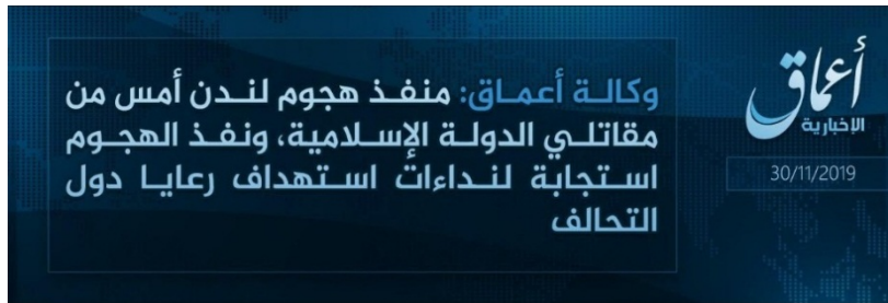
הודעת קבלת האחריות של דאעש (אעמאק באמצעות טלגרם, 30 בנובמבר 2019).

◀ ב-30 בנובמבר 2019, יום לאחר הפיגוע, קיבל עליו דאעש אחריות. בהודעת קבלת האחריות, שפרסמה סוכנות אעמאק של דאעש, צויין: "מבצע ההתקפה של לונדון אתמול נמנה על לוחמי המדינה האסלאמית. הוא ביצע את הפיגוע מתוך היענות לקריאות [הארגון] לתקוף אזרחים של מדינות הקואליציה [הבינלאומית נגד דאעש]" (טלגרם, 30 בנובמבר 2019). נוסח ההודעה עשוי להעיד כי המדובר בפיגוע השראה, שבוצע כהיענות לקריאות דאעש לפגוע במדינות הקואליציה. הריגתו של מנהיג דאעש אבו בכר אלבע'דאדי, עשויה הייתה להגביר את המוטיבציה של ג'האדיסטים תומכי דאעש לנקום את מותו. אולם בפועל בוצע עד כה רק הפיגוע בבריטניה.