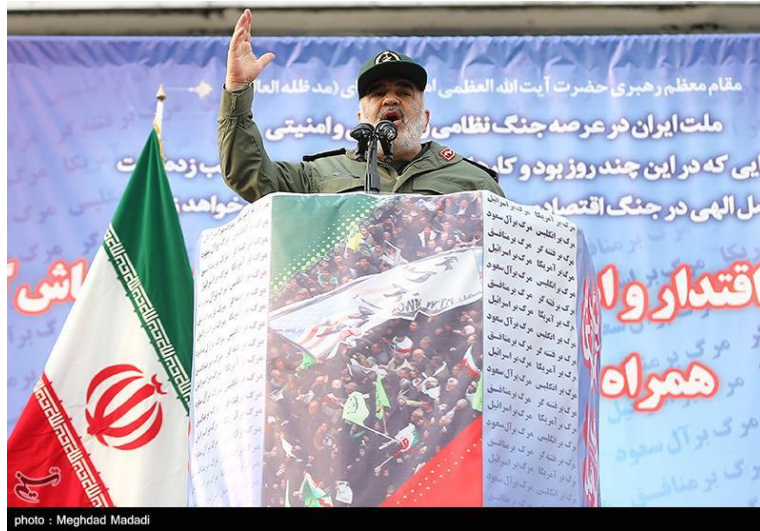
מפקד משמרות המהפכה, חסין סלאמי, בכנס בטהראן (25 בנובמבר 2019).