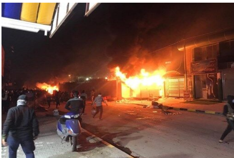
הצתת הקונסוליה האיראנית בנג'ף (אירן"א, 28 בנובמבר 2019).

◀ במסגרת המחאה הנמשכת בעיראק, הציתו מפגינים בליל ה-27 בנובמבר 2019 את הקונסוליה האיראנית בעיר נג'ף שבדרום עיראק. צוות הקונסוליה פונה, ככל הנראה, זמן קצר לפני תקיפת המבנה ולא דווח על נפגעים. בעקבות התקיפה הכריזו השלטונות העיראקים על עוצר בעיר (רויטרס, 27 בנובמבר 2019). איראן גינתה את תקיפת הקונסוליה והטילה על ממשלת עיראק את האחריות להגנתה. דובר משרד החוץ האיראני, עבאס מוסוי (Abbas Mousavi), אמר, כי ממשלת עיראק אחראית לביטחון הנציגויות הדיפלומטיות והדיפלומטים שבשטחה. הוא דרש, כי ממשלת עיראק תגיב בחומרה כנגד תוקפי הקונסוליה (Press TV, 28 בנובמבר 2019). יוזכר, כי ב-3 בנובמבר 2019 תקפו עשרות מפגינים גם את הקונסוליה האיראנית בכרבלאא'. הם טיפסו על המחסומים המקיפים את מבנה הקונסוליה, הסירו את דגל איראן והניפו במקומו את דגל עיראק.