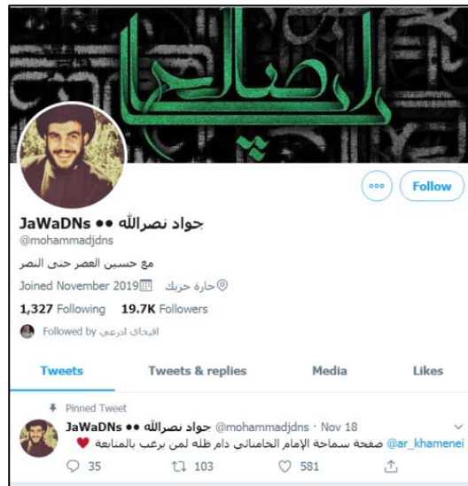
צילום מסך של החשבון החדש של ג'ואד נצראלה (טוויטר, 20 בנובמבר 2019).