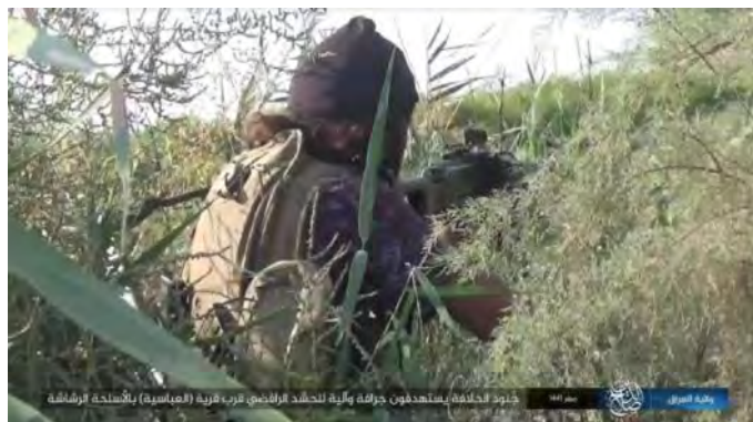
ירי מקלעים לעבר כלי רכב ודחפור של הגיוס העממי מצפון מערב לסאמראא' (טלגרם, 30 בספטמבר 2019).