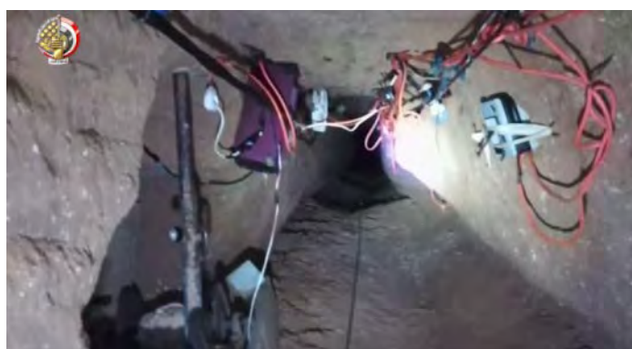
מימין: מנהרה שאותרה ע"י צבא מצרים. במנהרה תשתית חשמל וכנראה גם באמצעי תקשורת. משמאל: אופנועים של פעילי טרור, שהושמדו על-ידי צבא מצרים (דף הפייסבוק של דובר צבא מצרים, 27 בספטמבר 2019).

ב-29 בספטמבר 2019 הודיע משרד הפנים המצרי כי היחידה ללוחמה בטרור הרגה חמישה-עשר "פעילי טרור" בחווה, הממוקמת בפאתי אלעריש. נמסר, כי במהלך מעצרים פתחו פעילי הטרור באש לעבר לוחמי היחידה ללוחמה בטרור ונורו למוות (מצראוי, 29 בספטמבר 2019).