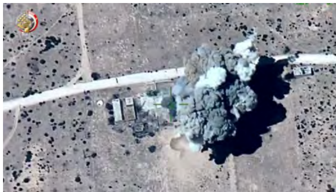
מימין: השמדת מקומות מסתור של פעילי טרור ע"י חיל האוויר המצרי. משמאל: ציוד צבאי שנתפס במהלך הפעילות הצבאית המצרית (דף הפייסבוק של דובר צבא מצרים, 27 בספטמבר 2019).