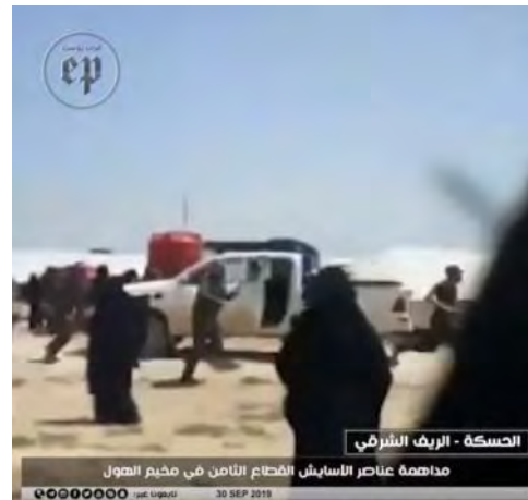
מימין: תיעוד ההתפרעויות. משמאל: אחד השומרים יורה באוויר (פראת פוסט, 5 באוקטובר 2019).