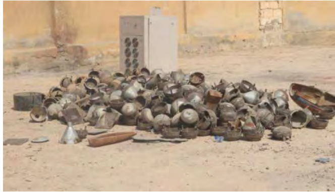
חומרי חבלה ומוקשים של דאעש שנמצאו בבית המלאכה (SDF Press, 1 באוקטובר 2019).

יחידת הנדסה של כוחות SDF חשפה מלאכה של דאעש, שפעל באחד מבתי הספר בהג'ין, 25 ק"מ מצפון לאלבוכמאל. היחידה נטרלה את מטעני החבלה והמוקשים שנמצאו במקום (SDF Press, 1 באוקטובר 2019).