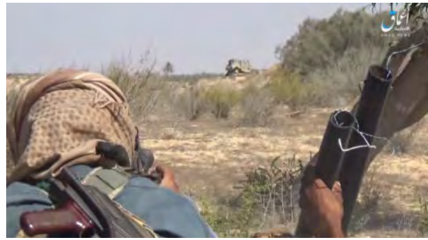
מימין: ירי מקלעים לעבר דחפור של צבא מצרים. משמאל: פגיעת רקטת נ"ט של דאעש בשריונית של צבא מצרים, שהיתה חלק מכוח שעסק במשימת החישוב (טלגרם, 2 באוקטובר 2019).