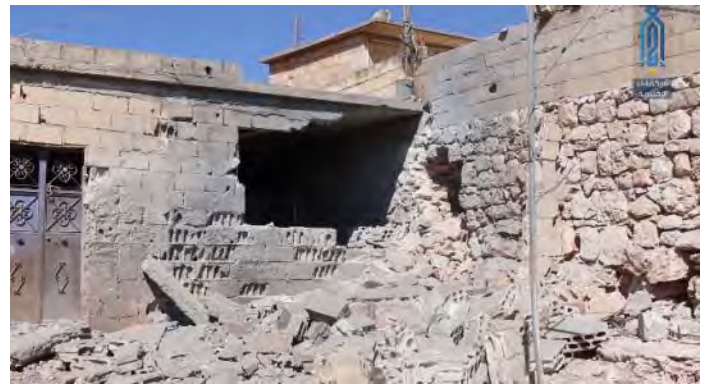
מבנים בכפר עויד, שמדרום מערב לאדלב, שנפגעו מירי ארטילרי של צבא סוריה (אבאא', 28 בספטמבר 2019).