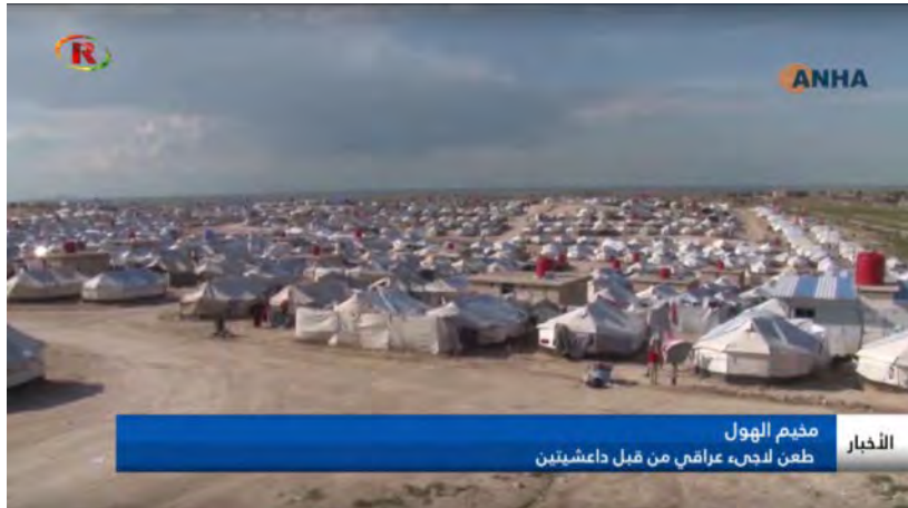
מחנה העקורים אלהול (Ronahi TV, 30 בספטמבר 2019).

במהלך חילופי האש נהרגה אחת הנשים ושבע נשים נוספות נפצעו. כמו כן נעצרו יותר מחמישים נשים. העצורות הואשמו בארגון ההתפרעויות ובניהול משפטי שדה, שהובילו להוצאה להורג של נשים המתנגדות לדאעש (פראת פוסט, 5 באוקטובר 2019; Ronahi TV, 30 בספטמבר 2019).