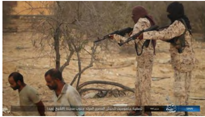
שני ה"סוכנים" של צבא מצרים מוצאים להורג ע"י פעילי דאעש (טלגרם, 26 בספטמבר 2019).