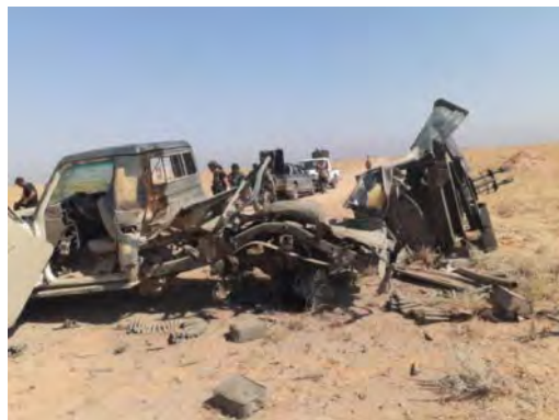
כלי רכב נושא תותח נ"מ דו-קני של צבא סוריה או שנפגע ממטען החבלה באזור אלמיאדין (פראת פוסט, 30 בספטמבר 2019).

להלן עיקרי פעילות דאעש במרחב שבין דיר אלזור לאלבוכמאל: