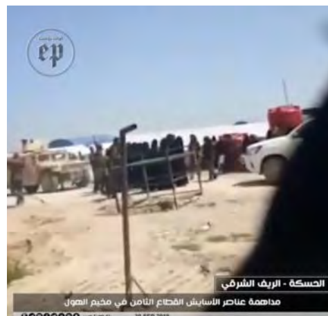
מימין: הכוחות הכורדיים מרכזים נשים שהשתתפו בהתפרעויות. משמאל: פינוי הנשים שהשתתפו בהתפרעויות (פראת פוסט, 5 באוקטובר 2019).