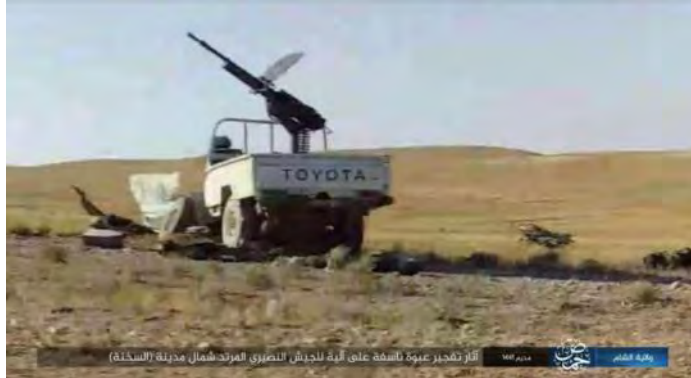
כלי הרכב של צבא סוריה, שנפגע מפיצוץ מטען של דאעש מצפון לאלסח'נה (טלגרם, 27 בספטמבר 2019).

דאעש. לפחות 11 פעילי דאעש ושבעה חיילי צבא סוריה נהרגו (מרכז המעקב הסורי לזכויות אדם, 4 באוקטובר 2019).