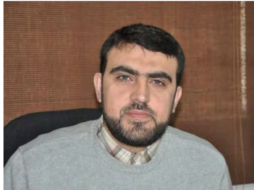
ד"ר אחמד כחיל, ראש עיריית אלנבטיה (ג'נוביה, 23 במאי 2014).

◆ ד"ר אחמד כחיל נבחר לראש עיריית נבטיה (אלנהאר, 23 באפריל 2016).